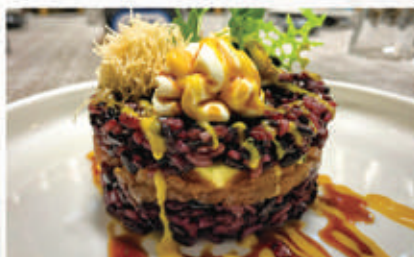
415. BLACK BURGER riso venere, spicy tonno, avocado, philadelphia, salsa teriyaki, salsa mango, kataifi 4.7.3.6.1. € 9,00