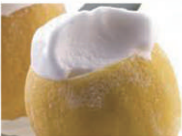
565. GELATO LIMONE RIPIENO € 5,00