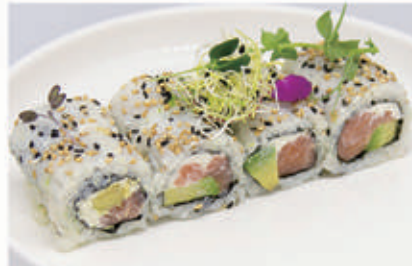
372. URAMAKI PHILADELPHIA Salmone, avocado, philadelphia 4.7 € 9,00