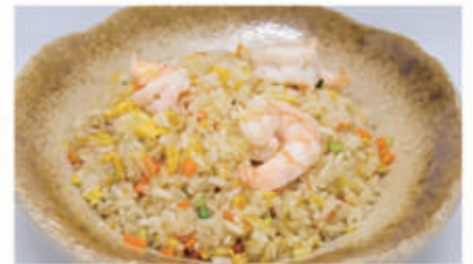
52. RISO SALTATO CON GAMBERI, VERDURA E UOVA 2,3 € 6,00