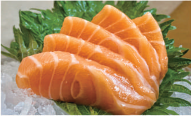
426. SASHIMI SALMONE 5PZ salmone 4. € 8,00

(solo 1 piatto a scelta tra 427, 428, 429, 430)