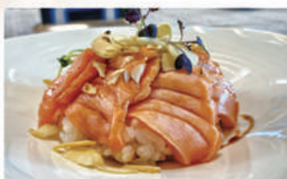
605. CHIRASHI SAKE FLAMBE Salmone scottato, riso, teriyaki, mandorle 4.1.6.5. € 10,00