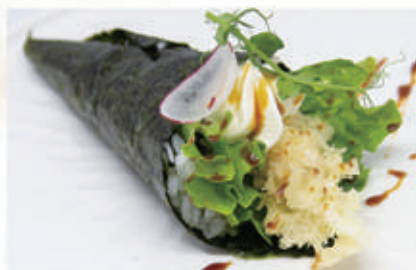
344. TEMAKI EBITEN Insalata, gambero fritto, philadelphia, teriyaki 1.2.6.7. € 6,00