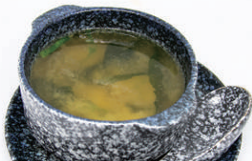
75. ZUPPA MISO Zuppa di soia con alghe e tofu € 4,00