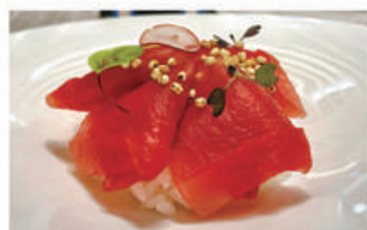
607. CHIRASHI TONNO Tonno, quinoa 4.8. € 10,00