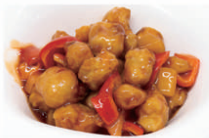
81. POLLO AGRODOLCE 1,6,11 € 7,00