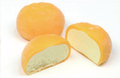
509. MOCHI PASSION 2PZ € 4,00