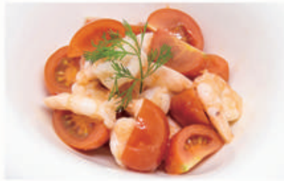
13. INSALATA DI GAMBERI E POMODORINI CON SEDANO 2,9 € 8,00