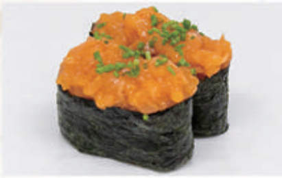
481. GUNKAN SPICY SALMONE Salmone piccante 10.4.3.7. € 3,00