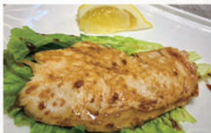
130. PETTO DI POLLO ALLA GRIGLIA 6,11 € 7,00