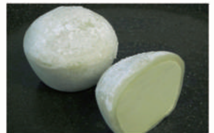
505. MOCHI THE VERDE 2PZ € 4,00