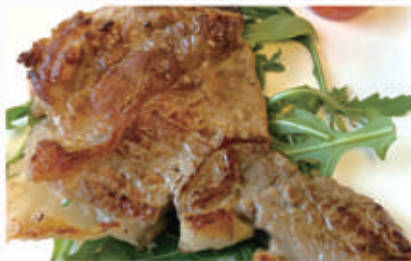
127. COSTATA DI VITELLO Fassona scottata con salsa BBQ € 8,00