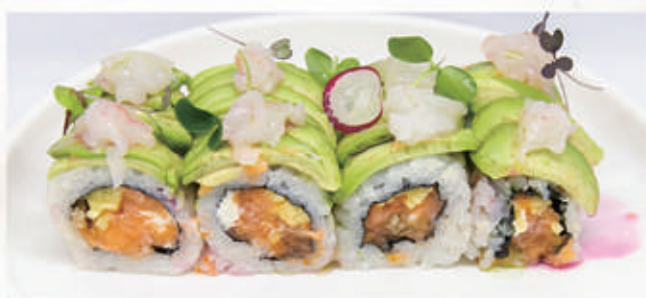
S21. SCAMPO ROLL salmone, mango, salsa spicy maio, polvere di tempura, top di avocado, salsa rose, salsa shiso 4.1.2.6.7 € 16,00