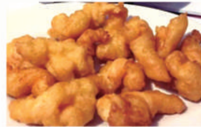
157. POLLO FRITTO 1,3,6,11 € 7,00