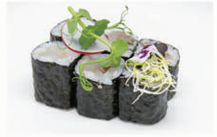
323 HOSO SUZUKI Branzino 4 . € 5,00