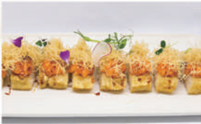
364. OSHIZUSHI TEMPURA PZ Riso in tempura, spicy salmone, mousse di avocado, salsa mango 10.3.1.6.7. € 8,00