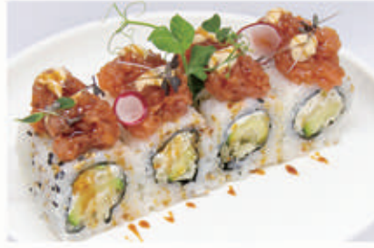
381. ZUCCA ROLL Fior di zucca in tempura, philadelphia, spicy tonno, salsa tartufo, teriyaki 10.11.4.3.5.1.8.6.7. € 12,00