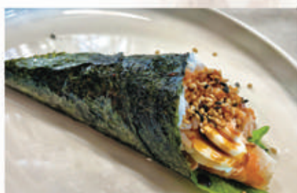
351. TEMAKI TONNO COTTO tonno cotto, philadelphia, gamberi cotto, avocado, teriyaki, sesamo 4.7.3.14.1.11.6. € 6,00