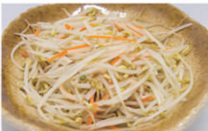
170 GERMOGLI DI SOIA SALTATI 6. € 5,00