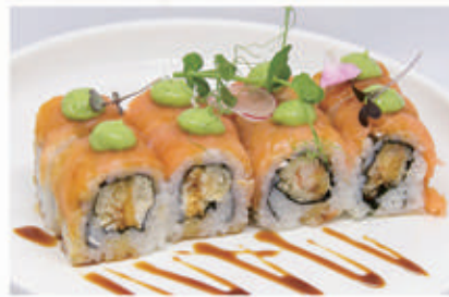
384. SMOKING ROLL maionese, gambero in tempura, top di salmone affumicato, mousse di avocado, teriyaki 10.4.3.1.2.6.7. € 12,00