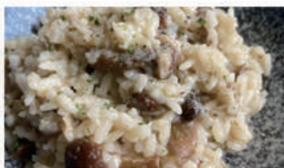
56. RISOTTO CON FUNGHI PORCINI € 12,00