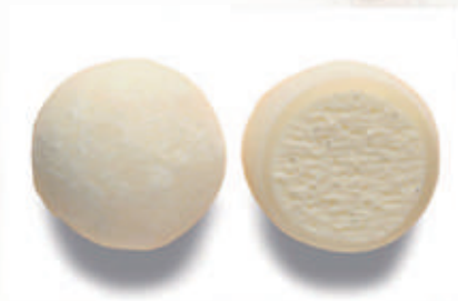
503. MOCHI VANIGLIA 2PZ € 4,00