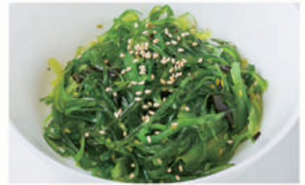
14. GOMMA WAKAME 11 € 7,00