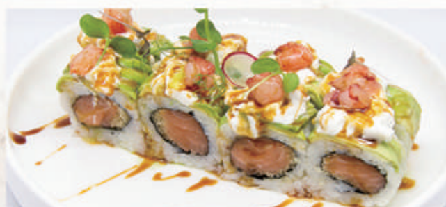
S16. BURRATA ROLL Salmone, polvere di tempura ricoperto di avocado, burrata, gamberi rossi, olio di shiso, salsa teriyaki 10.3.2.6 € 15,00