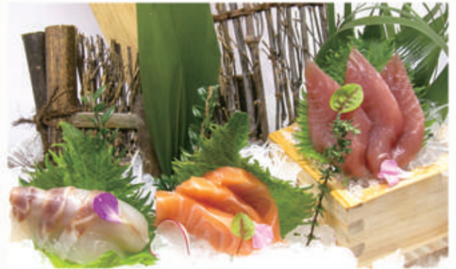
427. SASHIMI MISTO pesce misto 4. € 14,00