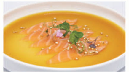
416. CARPACCIO SALMONE Salmone, salsa ponzu, quinoa 11.4.1.8.6. € 8,00