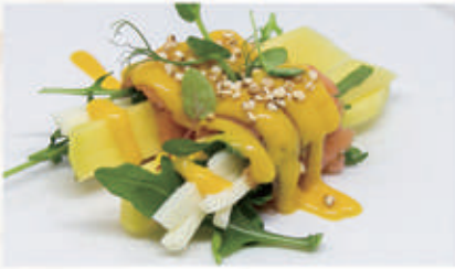
301. AFFUMICATO ROLL Salmone affumicato, rucola, mango, philadelphia, salsa mango, quinoa 10.11.4.3.1.8.6.7. € 6,00