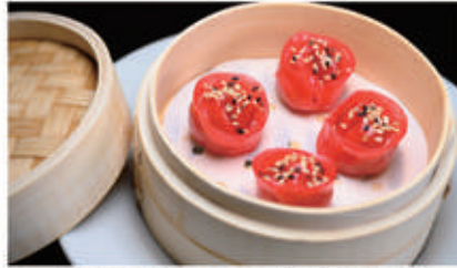
38. RAVIOLI DI MANZO 1,6,11 € 6,00