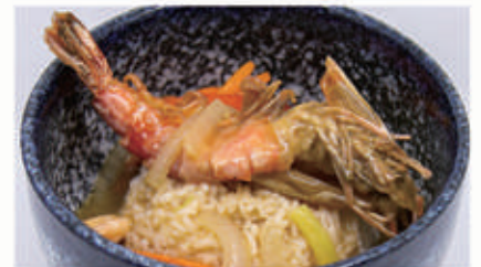
55. CHUKA DON Riso bianco con gamberoni, gamberetti e verdure 2,6,11 € 9,00