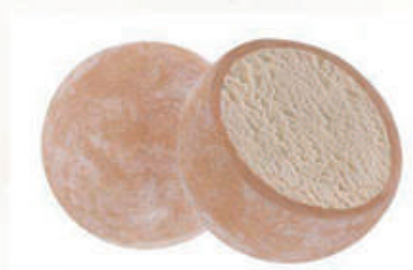
507. MOCHI NOCCIOLA 2 PZ € 4,00