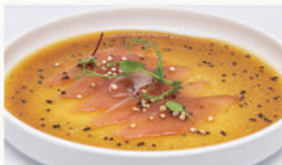
● 418. CARPACCIO TONNO Tonno, salsa wasabi, quinoa 11.4.1.8.6. € 9,00