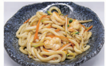
65. YAKI UDON Pasta di riso saltato con gamberi, verdure e uova 2,3,6,11 € 10,00