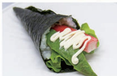
345. TEMAKI CALIFORNIA Insalata, polpo di granchio, maionese, avocado 10.3.2.7. € 5,00