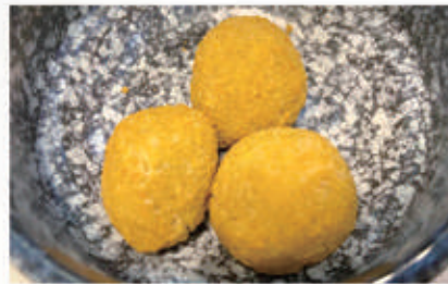
164. OLIVE FRITTI 1,3. € 5,00