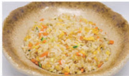
51. RISO SALTATO CON VERDURA E UOVA 3 € 5,00