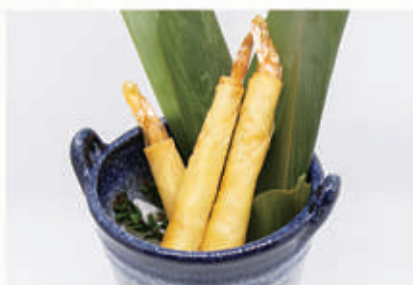
08. STICK DI GAMBERI 1,2,3,6,11 € 5,00