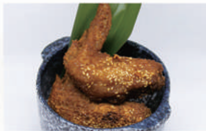
● 21. TORINO KARAGE 1PZ 1,3,6,11 € 4,00