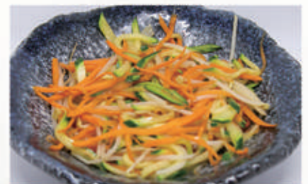
172. VERDURE MISTE SALTATO 6. € 5,00