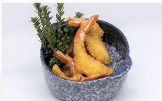
153. EBI FURAI Gamberi impanati 1,2,3,6,11 € 8,00