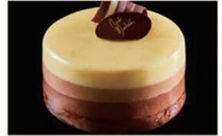
290. DOLCE TRIS DI CIOCCOLATI tre strati di mousse al cioccolato (bianco, al latte e fondente) e alla base un pan di spagna al cacao € 6,00