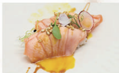
466. NIGIRI SALMONE SCOTTATO Salmone scottato, salsa latte, teriyaki, quinoa 10.11.4.3.1.8.6.7. € 5,00