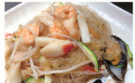
68. SPAGHETTI DI SOIA AI FRUTTI DI MARE verdure e frutti di mare 2,6,11,14 € 6,00