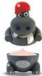
564. GELATO HIP POP FRAGOLA € 5,00