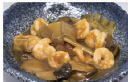
92. GAMBERI FUNGHI E BAMBÙ 2,6,11 € 8,00