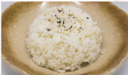
53. RISO BIANCO € 3,00