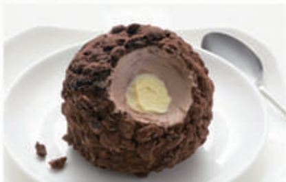
575. TARTUFO CLASSICO € 5,00