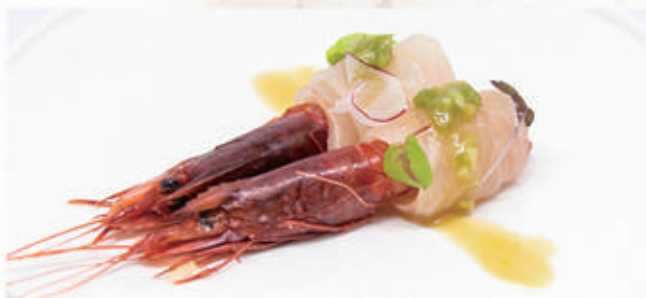
S12. RICCIOLA MAZARA ROLL Ricciola, gambero rosso di mazara, wasabi fresco, salsa miso, quinoa 11.4.1.2.8.6 € 9,00