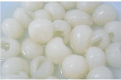
518. FRUTTA MACEDONIA CINESE € 3,00