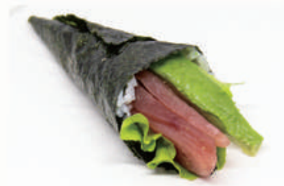
343. TEMAKI TONNO Insalata, tonno, avocado, erba cipollina 11.4. € 6,00