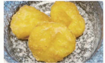
162. CHICKEN NUGGETS 1,3. € 6,00