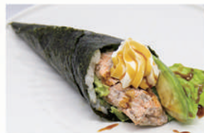
346. TEMAKI MIURA Insalata, salmone grigliato, phila, avocado, teriyaki, sesamo 11.4.1.8.6.7. € 5,00