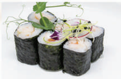
324. HOSO EBI Gambero cotto 2 . € 5,00