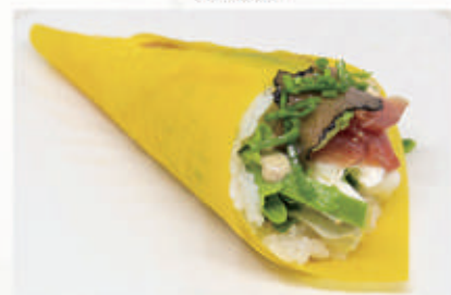
350. TEMAKI TONNO TARTUFO Alghe di soia, insalata, tonno, avocado, phila, salsa tartufo, fette di tartufo, erba cipollina 10.11.4.3.5.1.8.6.7. € 7,00