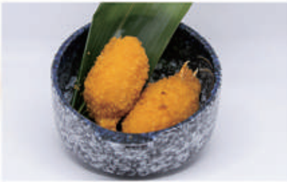
150. CHELE DI GRANCHIO FRITTO 1,2,3 € 6,00