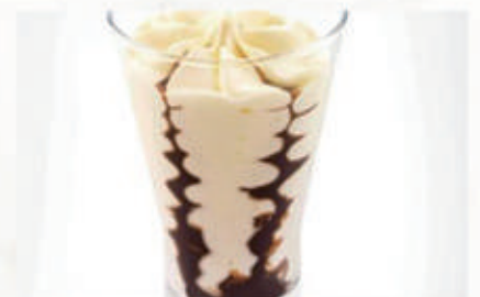
568. GELATO COPPA CIOCCOLATO € 6,00