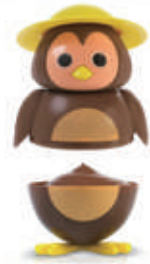
561. GELATO CIP CIOK CIOCCOLATO € 5,00