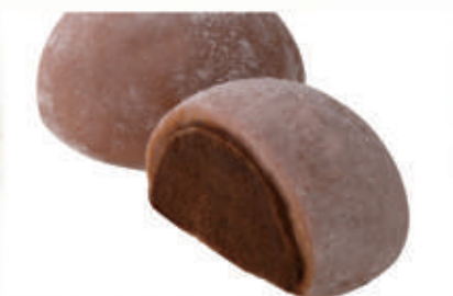
506. MOCHI CIOCCOLATO 2 PZ € 4,00