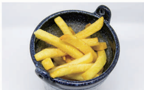
155. PATATINE FRITTE € 5,00