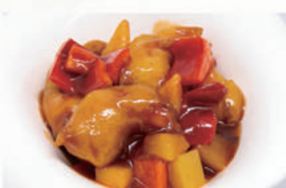
97. GAMBERI IN SALSA AGRODOLCE 1,2,6,11 € 8,00