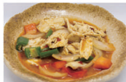
82. POLLO IN SALSA PICCANTE 6,11 € 7,00