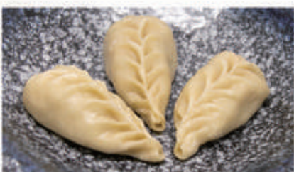
34. RAVIOLI DI VERDURE 1,6,11 € 5,00