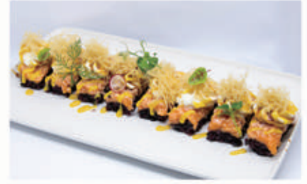
363. OSHIZUSHI BLACK 4PZ Riso venere, spicy salmone flambe, phila, teriyaki, salsa mango, kataifi 10.3.1.8.6.7. € 9,00