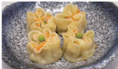
32. RAVIOLI SHAMAI Ravioli di carne con gambero 1,3,6,11 € 6,00