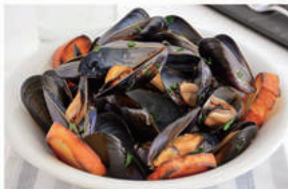
94. PEPATA DI COZZE 14 € 6,00