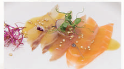
● 419. CARPACCIO MISTO Salmone, tonno, branzino, salsa miso, quinoa 11.4.1.8.6. € 9,00