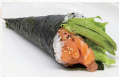
341. TEMAKI SALMONE Insalata, salmone, avocado, sesamo 11.4. € 5,00