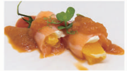
303. ORANGE SAKE ROLL Salmone, arancia, philadelphia, salsa yamakawa, quinoa 11.4.1.8.6.7. € 6,00