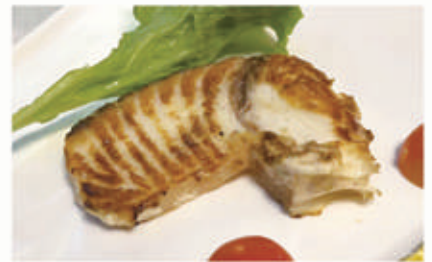
133. PESCE VERDESCA ALLA GRIGLIA € 8,00