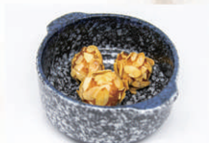
07. POLPETTE DI GAMBERI CON MANDORLE 1,2,3,6,8,11 € 9,00