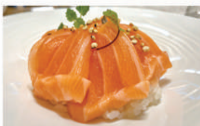
606. CHIRASHI SAKE Salmone, quinoa 4.8. € 10,00