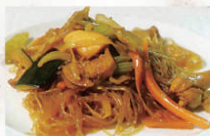
70. SPAGHETTI DI SOIA CON POLLO VERDURE 6,11 € 6,00