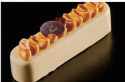
291. DOLCE MOKA crema bavarese al caffè, cremoso al caramello e alla base croccantino al latte. Copertura di cioccolato bianco e arachidi salate € 6,00