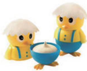
563. GELATO TWITTY FIOR DI LATTE € 5,00