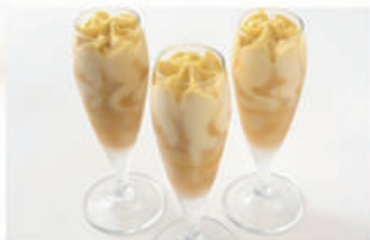
571. GELATO FLUTE MANGO PASSION FRUIT € 6,00