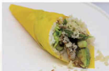
348. TEMAKI ANGUILLA Alghe di soia, insalata, anguilla, avocado, teriyaki, polvere di tempura 4.1.6. € 7,00