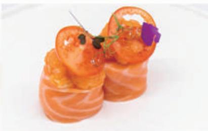
492. BIGNE SALMONE Salmone, spicy salmon 10.4.3.7. € 6,00