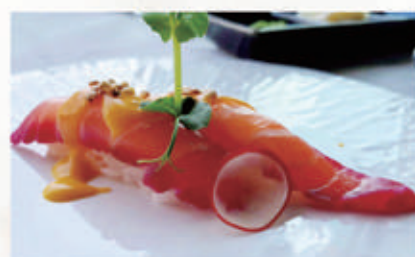
● 471. NIGIRI SALMONE ROSE 2PZ salsa mango quinoa 11.4. € 6,00