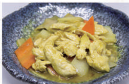
80. POLLO CURRY 6,11 € 7,00