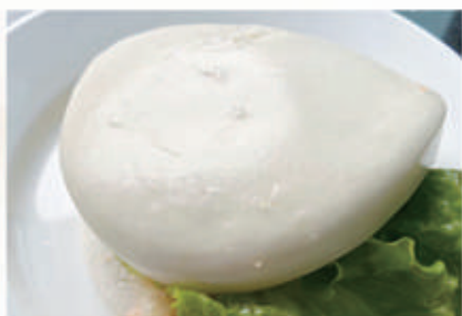
10. BAO TEMPURA 1. € 6,00