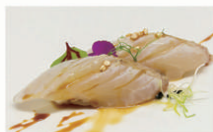
467. BRANZINO SCOTTATO Branzino scottato, salsa latte, salsa teriyaki, quinoa 11.4.3.1.8.6.7. € 5,00