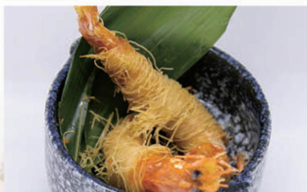
158. GAMBERI KATAIFI 1PZ 1,2,3,6,11 € 5,00