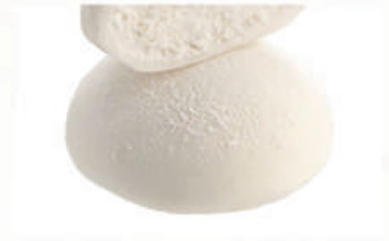
502. MOCHI COCCO 2 PZ € 4,00