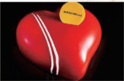
282. DOLCE RED PASSION mousse alla fragola con cremoso alla vaniglia e perline croccanti al cioccolato al Latte, base croccante al cioccolato bianco € 6,00