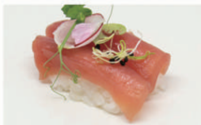
461. NIGIRI TONNO nigiri tonno 4 € 5,00