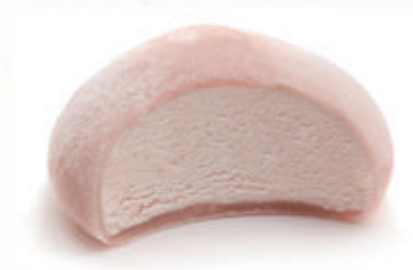
501. MOCHI FRAGOLA 2 PZ € 4,00