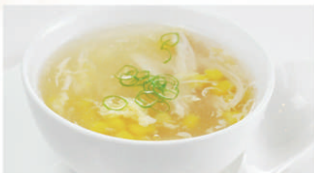
77. ZUPPA CON MAIS E POLLO 11 € 5,00