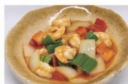
98. GAMBERI IN SALSA PICCANTE 2,6,11 € 8,00