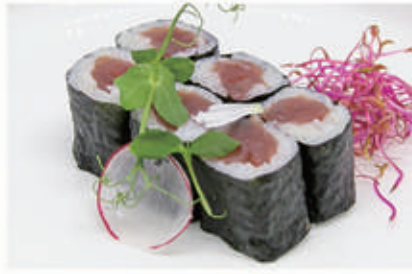
322. HOSO TUNA Tonno 4 . € 5,00