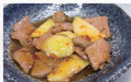
100. MANZO MALESIA Manzo saltato con peperoni, cipolla e salsa agropiccante 6,11 € 7,00