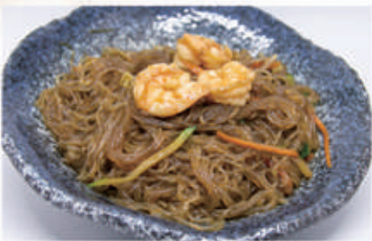
63. SPAGHETTI DI SOIA CON GAMBERI E VERDURA 2,6,11 € 6,00