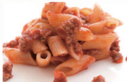
67. PENNE DI RAGÙ Sugo di pomodoro e carne manzo € 10,00