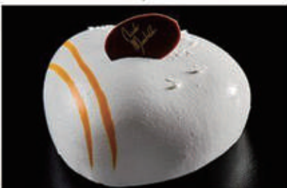
285. DOLCE COCCO E PASSION mousse al cocco, cremoso al mango e passion fruit, pan di spagna e alla base frolla sablée € 6,00