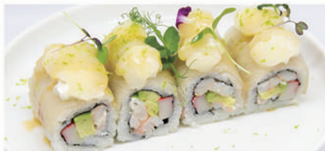
S15. CAPESANTE ROLL Gamberi cotto, granchio, maionese, avocado, top di branzino, philadelphia, carpaccio di capesante, salsa miso, scorze di lime 10.4.3.1.14.2.6.7 € 16,00