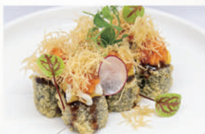
330 HOSO SPICY KATAIFI Hoso salmone e philadelphia fritto, spicy 4.1.8.6.7 . € 9,00