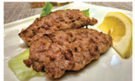
129. SALSICCIA PIASTRA € 6,00