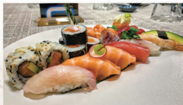
611. SUSHI SASHIMI MISTO PLUS sashimi misto 7pz, 7 nigiri, 2 uramaki, 4 hosomaki, 1 gunkan 4.3.7.2. € 20,00