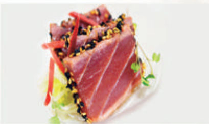
306. TONNO TATAKI tonno scottato con sesamo e teriyaki 4.11.1.6. € 12,00