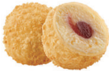
510. MOCHI CHEESECAKE 2PZ € 4,00