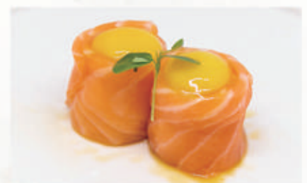
494. BIGNE QUAGLIA Salmone, uova di quaglia, ponzu, tobiko 4.3.1.6. € 7,00