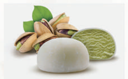
508. MOCHI PISTACCHIO 2PZ € 4,00