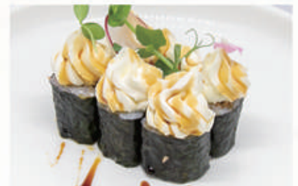
326. HOSO MIURA Salmone grigliato, teriyaki, philadelphia 4.1.6.7 . € 5,00