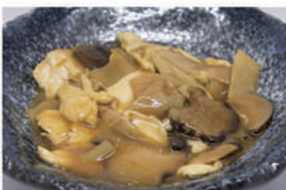
84. POLLO FUNGHI E BAMBÙ 6,11 € 7,00