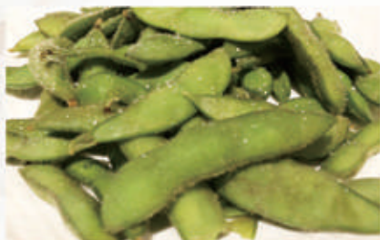
01. EDAMAME Baccelli di soia 6. € 5,00