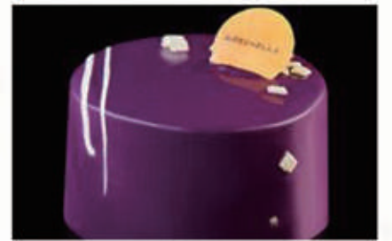
281. DOLCE BOSCO mousse al mascarpone e vaniglia, cremoso ai frutti di bosco, pan di spagna al cacao € 6,00