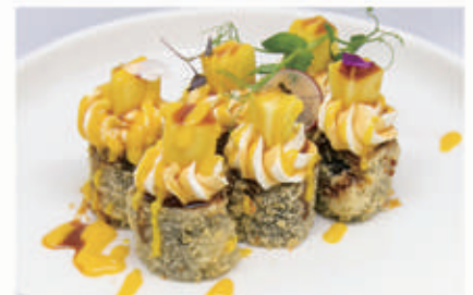
329. HOSO SPECIAL MANGO Hoso salmone fritto, phila, mango, teriyaki, salsa mango 10.4.3.1.6.7 . € 8,00