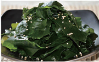
15. WAKAME 6,11 € 5,00