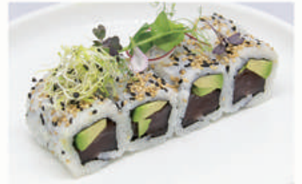
373. URAMAKI MAGURO Tonno, avocado, sesamo 11.4.8. € 9,00