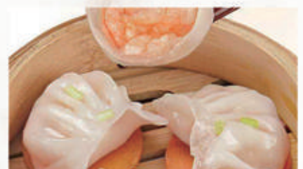
36. RAVIOLI DI GAMBERI IN CRISTALLO 1,2,6,11 € 6,00