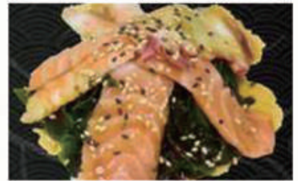
19. SUNOMONO 1,2,4,6,11,14 € 8,00