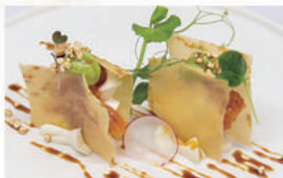
490. MILLEFOGLIE DI TONNO Strati di pasta, ripieno di tonno, philadelphia, salsa verde, teriyaki soffione di quinoa 10.11.3.1.8.6.7. € 7,00