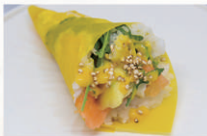
349. TEMAKI AFFUMICATO Alghe di soia, insalata, salmone affumicato, philadelphia, mango, rucola, salsa mango, quinoa 10.11.4.3.1.8.6.7. € 6,00