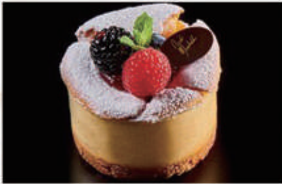
288. DOLCE CHEESECAKE crema al formaggio su crumble salato con confettura di lampone e frutti di bosco € 6,00