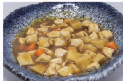
85. POLLO ALLE MANDORLE 6,8,11 € 7,00