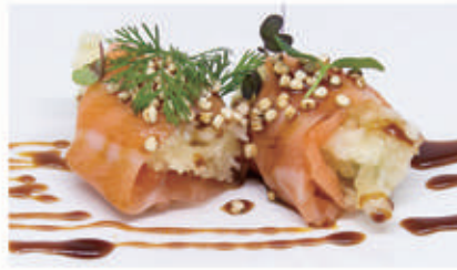
302. EBITEN ROLL Salmone, phila, tempura di gamberi, teriyaki, kataifi 4.1.2.8.6.7. € 6,00