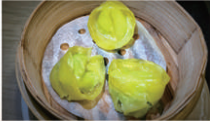
40. RAVIOLI SPINACI 1,6,11 € 5,00