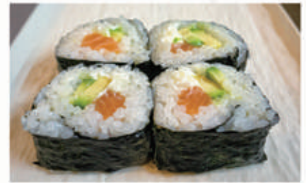
413. FUTOMAKI SALMONE Salmone, avocado, philadelphia 3.4.7. € 6,00