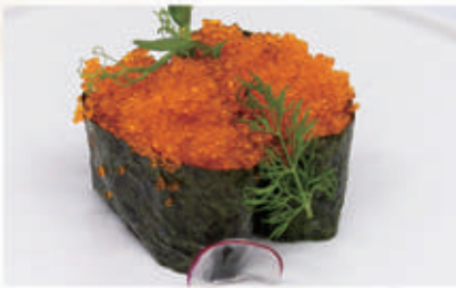
484. GUNKAN TOBIKO Uova di pesce volante 4. € 3,00