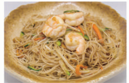
62. SPAGHETTI DI RISO SALTATO CON GAMBERI, VERDURA E UOVA 2,3,6,11 € 6,00