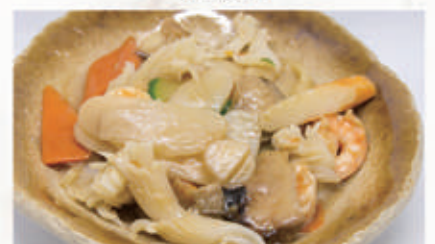
58. GNOCCHI DI RISO AI FRUTTI DI MARE Verdure e frutti di mare 2,6,11,14 € 6,00