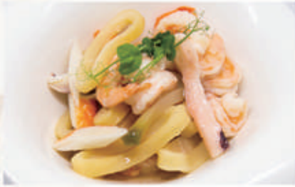
12. INSALATA DI MARE 2,14 € 8,00