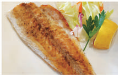
132. PESCE BRANZINO GRIGLIA € 8,00