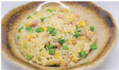
50. RISO CANTONESE Riso con piselli, uova e prosciutto cotto 3 € 5,00