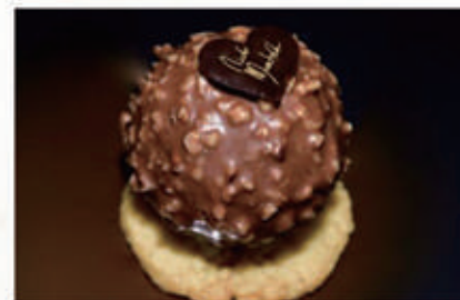
286. DOLCE SEDUZIONE mousse al cioccolato al latte affogata in una copertura di cioccolato al latte e granella di nocciole, al suo interno una nocciola caramellata e alla base disco croccante di crumble salato € 6,00