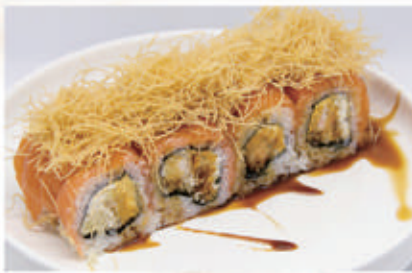
383. TIGER ROLL Gamberi in tempura, maionese, top di salmone, salsa teriyaki e kataifi 4.1.2.8.6.7. € 13,00