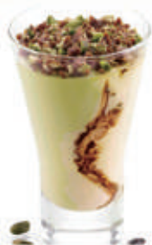
569. GELATO COPPA CREMA PISTACCHIO € 6,00