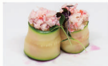
497. BIGNE ZUCCHINE Zucchine, avocado, granchio, gambero cotto, maionese giapponese, tobiko, salsa rose 10.3.2.7. € 6,00