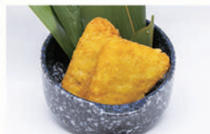
06. POLPETTE DI PATATE FRITTE polpette di patate fritte 1,3,6,7,11 € 5,00