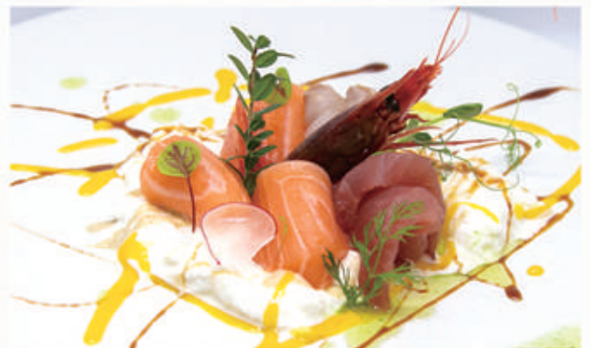
429. MISTO BURRATA TARTUFATA Burrata, salmone 3pz, tonno 2pz, branzino 2pz, gambero rosso 1pz, teriyaki, salsa tartufo, olio di shiso, quinoa 10.11.4.32.1.5.8.7. € 15,00