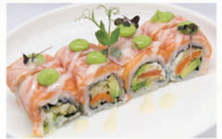
385. TEMPURA SALMONE ROLL Salmone fritto, philadelphia, avocado, top di salmone flambe, mousse di avocado, salsa latte 10.1.6.7. € 14,00