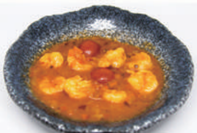
91. GAMBERI THAI Gamberi in salsa thai piccante 2,6,11 € 8,00