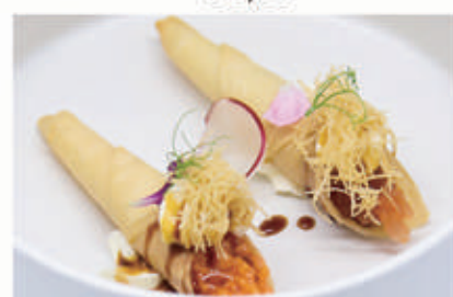
347. TEMAKI CROCCANTE Due temaki fritti (spicy tonno, spicy salmone) con sfoglia di pasta, phila, teriyaki, kataifi 10.3.1.8.6.7. € 6,00