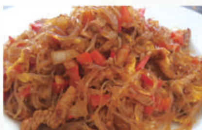
69. SPAGHETTI DI SOIA CON POLLO PICCANTE 6,11 € 6,00