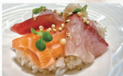
608. CHIRASHI MISTO Misto di pesce, quinoa 4.8. € 10,00