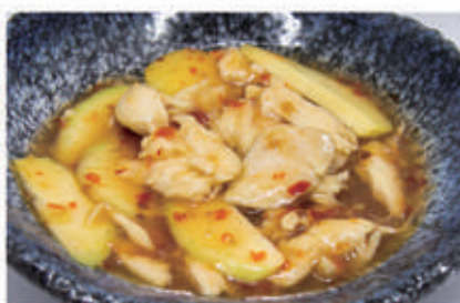
83. POLLO ALLA MALESIA € 7,00