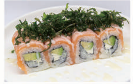
382. RUCOLA ROLL Avocado, philadelphia, sopra salmone, salsa latte, scottato, rucola fritta 10.4.3.7. € 12,00