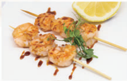
120. SPIEDINI DI GAMBERI ALLA GRIGLIA 6,11 € 6,00