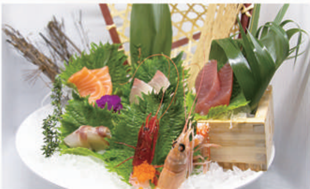
428. SASHIMI MISTO SPECIALE pesce misto fatto dallo chef 4.2. € 18,00