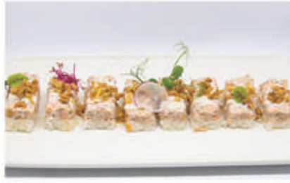
362. OSHIZUSHI MIURA 4PZ Salmone grigliato, phila, salsa latte e cipolla croccante 10.4.3.7. € 8,00