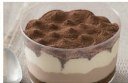
573. COPPA TIRAMISÙ € 5,00