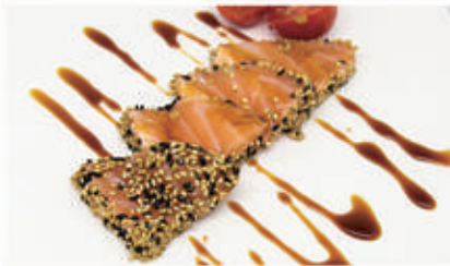
307. SAKE TATAKI salmone scottato con sesamo e teriyaki 4.11.1.6. € 10,00