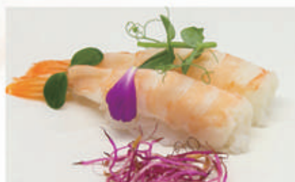
463. NIGIRI GAMBERO COTTO nigiri gambero 2 € 4,00