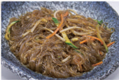
60. SPAGHETTI DI SOIA CON VERDURA 6,11 € 5,00