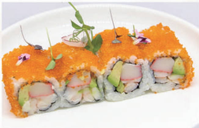
374. URAMAKI CALIFORNIA Surimi, avocado, gamberi cotto, maionese, tobiko 10.4.3.2.7 € 9,00