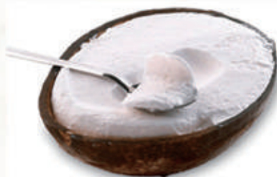
566. GELATO COCCO RIPIENO € 5,00