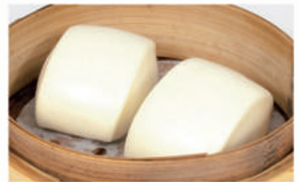
30. PANE AL VAPORE 1,7 € 4,00