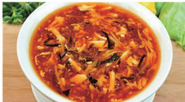
76. ZUPPA SALSA AGROPICCANTE 6,11 € 5,00