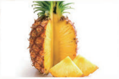
515. FRUTTA ANANAS FRESCO € 4,00