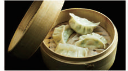
39. RAVIOLI DI POLLO 1,6,11 € 5,00