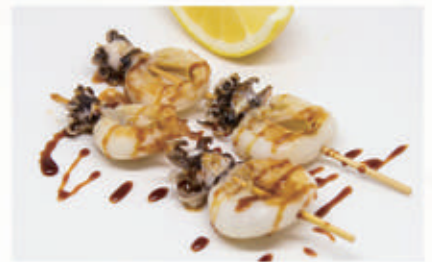
126. YAKI IKA Spiedini di seppie alla griglia 6,11,1,6 € 7,00