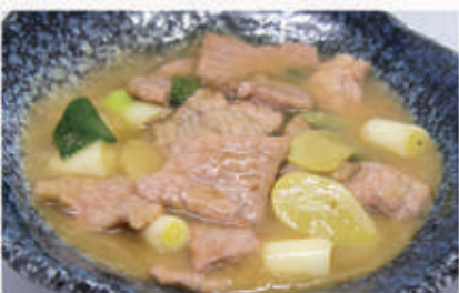
101. MANZO CON ZENZERO E CIPOLLOTTI 6,11 € 7,00