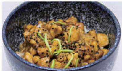
54. TORI DON Riso bianco con pollo in salsa teriyaki 6,11 € 9,00