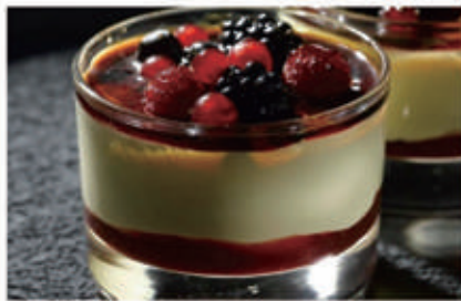
279. SORBETTO LIMONE € 4,00