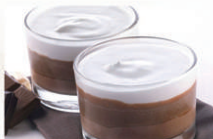
577. COPPA TRE CIOCCOLATI € 5,00