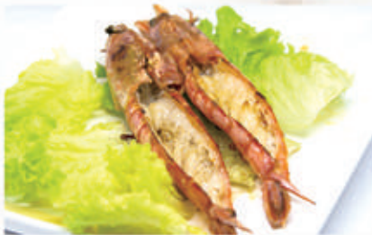
122. GAMBERONI ALLA PIASTRA 2 € 8,00