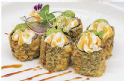
327. HOSO SPECIAL AVOCADO Hoso salmone fritto, phila, mousse di avocado, teriyaki 10.4.3.1.6.7 . € 8,00