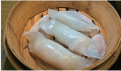
37. RAVIOLI DI MERLUZZO 1,4,6,11 € 6,00