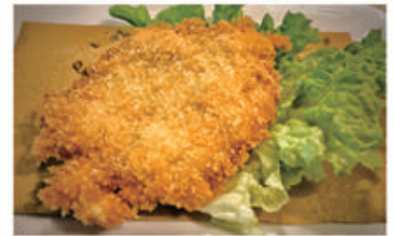
166. COTOLETTA DI POLLO ALLA MILANESE 1,3,6,11 € 6,00