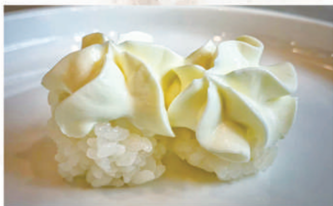
489. BIGNE SNOWBALL riso sushi, philadelphia 3.1.7. € 5,00