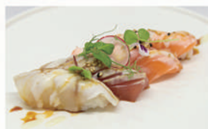
465. NIGIRI SCOTTATO MISTO 4PZ Salmone 2pz, tonno 1pz, branzino 1pz, salsa teriyaki e salsa latte, scottato, sesamo 10.11.4.3.1.8.6.7. € 7,00