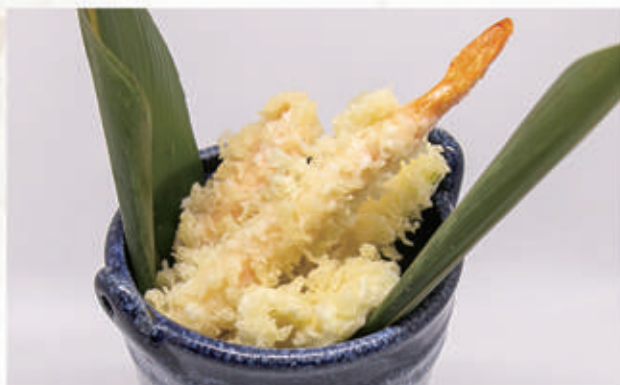
151. TEMPURA MORIOWASE Gamberi e verdura 1,2 € 7,00