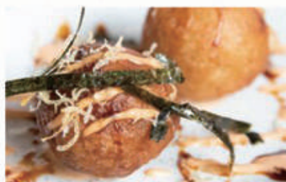
05. POLPETTE DI POLIPO E PATATE FRITTE polpette di polipo e patate fritte con salsa teriyaki 1,3,6,7,11,14 € 7,00