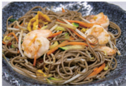
61. YAKI SOBA Pasta di grano saraceno saltato con gamberi e verdure 2,3,6,11 € 10,00