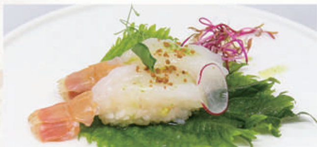
S9. NIGIRI SCAMPI Scampi, olio di shiso, dry miso 1.2.6 € 8,00