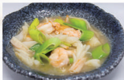
93. FRUTTI DI MARE SALTATI 2,6,11,14 € 8,00