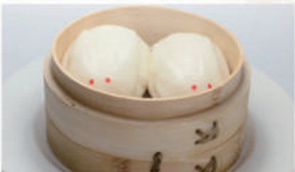
31. BAO CON CREMA ALL'UOVO 1,3,7 € 5,00