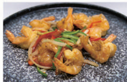
95. GAMBERI SALE E PEPE 2 € 8,00