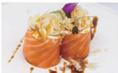
496. BIGNE PHILADELPHIA Salmone, philadelphia, teriyaki, polvere di tempura 4.1.6.7. € 6,00