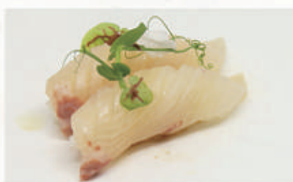
● 470. NIGIRI RICCIOLA Ricciola, ponzu, salsa yuzu 4.1.6. € 6,00