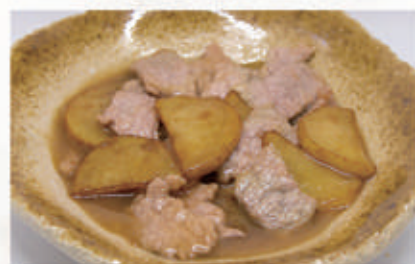
102. MANZO CON PATATE 6,11 € 7,00