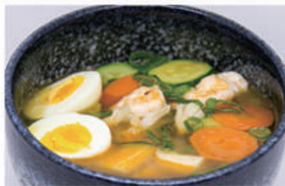
64. RAMEN IN BRODO Ramen in brodo con frutti di mare, alghe uova e erba cipollina 2,3,6,11,14 € 8,00