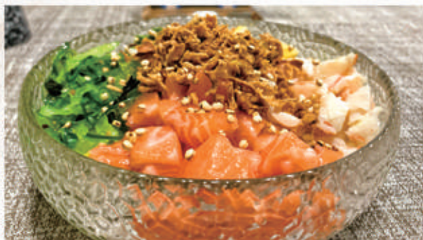
601. POKE SUSHI mango, avocado, gamberi cotto, wakame, salmone, cipolla frita, salsa teriyaki, quinoa 4.14.1.6.8. € 8,00