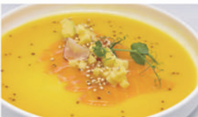
● 417. CARPACCIO SALMON PASSION FRUIT Salmone, mango, salsa passion fruit, soffione di quinoa 10.11.4.1.8.6. € 8,00