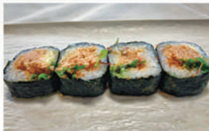
412. FUTO TONNO COTTO tonno cotto, maionese, wakame goma, tobiko, gambero cotto, teriyaki 4.1.3.6.7.14. € 6,00