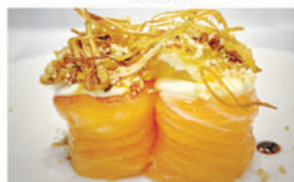
500. BIGNE CHICKEN salmone, maionese, pollo fritto, teriyaki, cipolle fritte 3.5.1.6.7. € 5,00