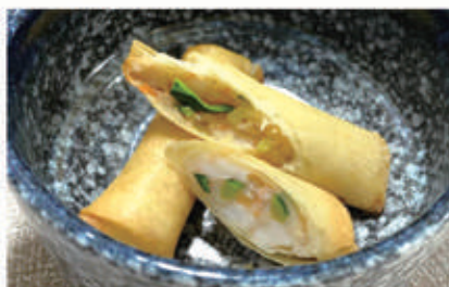
02. HARUMAKI harumaki con verdure e gamberi 2,6,11. € 4,00