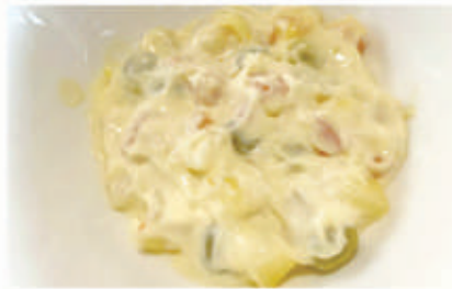
17. INSALATA RUSSA 3 € 6,00