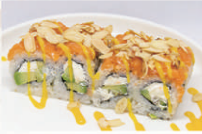
380. MANDORLE ROLL Avocado, philadelphia, spicy salmone esterno, salsa mango 10.4.3.5.8.7 € 12,00