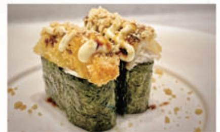
486. GUNKAN CHICKEN pollo fritto, maionese, teriyaki, mandorle 3.5.1.8.6.7. € 4,00