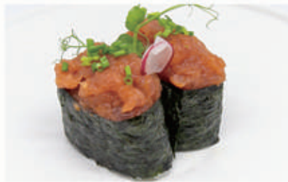
482. GUNKAN SPICY TONNO Tonno piccante 10.4.3.7. € 4,00