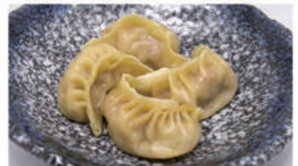
33. RAVIOLI DI CARNE Ravioli di carne 1,3,6,11 € 5,00