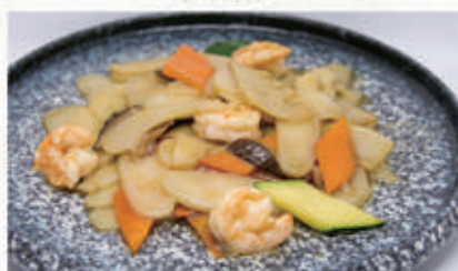
57. GNOCCHI DI RISO CON GAMBERI E VERDURE 2,6,11 € 6,00