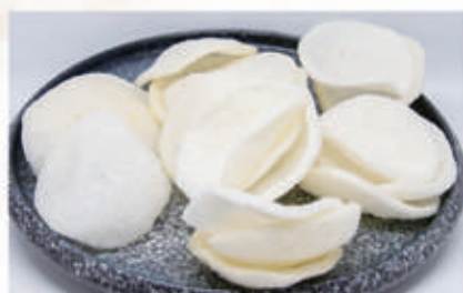
04. NUVOLE DI DRAGO Chips di gambero 2. € 2,00