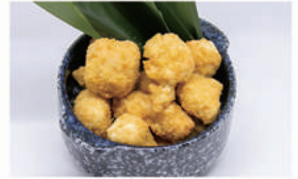
154. BOCCONCINI DI SALMONE FRITTO 1,3,4,6,11 € 6,00