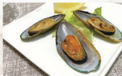
131. COZZE ALLA GRIGLIA 3PZ 1,14 € 5,00