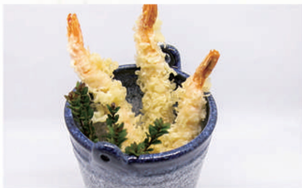
159. TEMPURA GAMBERI 1,2 € 8,00