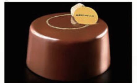
287. DOLCE BOGOTA' mousse al cioccolato fondente al 60%, cremoso alla nocciola con perline di cioccolato, base di frolla € 6,00