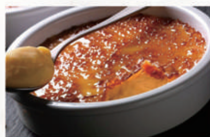
580. CREMA CATALANA IN COCCIO € 6,00