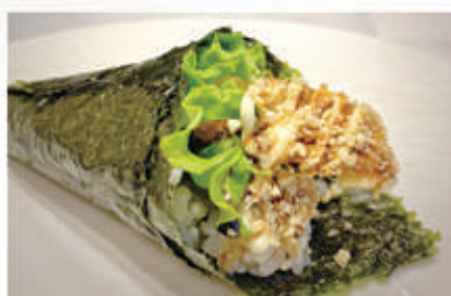
352. TEMAKI CHICKEN insalata, maionese, pollo fritto, teriyaki, mandorle 11.3.1.8.6.7. € 5,00