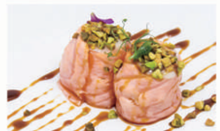
491. BIGNE PURA Bignè scottato salmone, purea, salsa latte, teriyaki, pistacchio 4.5.1.8.6.7. € 6,00