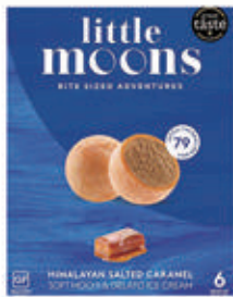
512. MOCHI 2PZ caramel € 4,00