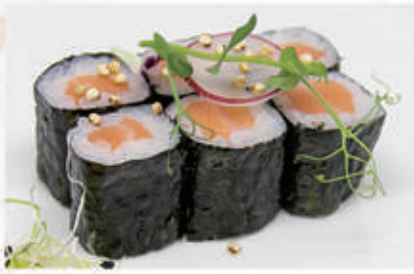
321. HOSO SALMON Salmone 4 . € 5,00