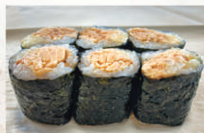
331 HOSO TONNO COTTO tonno cotto, maionese 4.1.6 . € 6,00