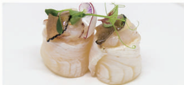
S11. BIGNÈ TARTUFO Pesce bianco scottato, amaebi scottato, salsa tartufo, fette di tartufo 10.11.3.1.8.6.7 € 6,00