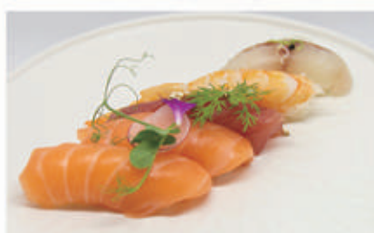
464. NIGIRI MISTO 5PZ Salmone 2pz, tonno 1pz, branzino 1pz, gambero cotto 1pz 4,2 € 7,00