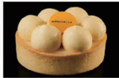
283. DOLCE YUZU TART fondo di pasta frolla, ganache allo yuzu, bavarese alla vaniglia € 6,00