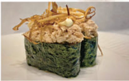
487. GUNKAN TUNA ONION TONNO cotto, maionese, teriyaki, cipolla fritto 4.3.1.7. € 5,00