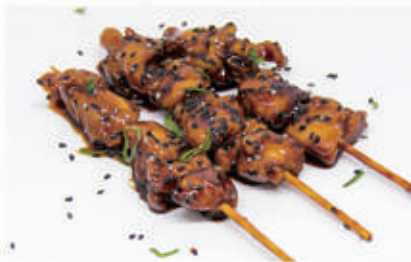
125. YAKI TORI Spiedini di pollo con salsa teriyaki 6,11,1,6 € 7,00