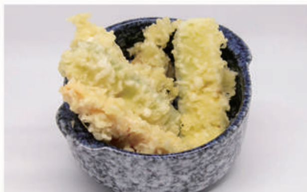
152. TEMPURA YASAI Verdura 1 € 6,00