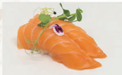
460. NIGIRI SALMONE nigiri salmone 4 € 4,00