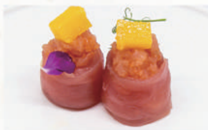
493. BIGNE TONNO Tonno, spicy tonno, arancia 10.4.3.5.7. € 6,00