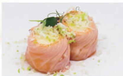
498. BIGNE FLAMBE Salmone, salsa latte, scottati, formaggio, lime 10.4.3.7. € 6,00