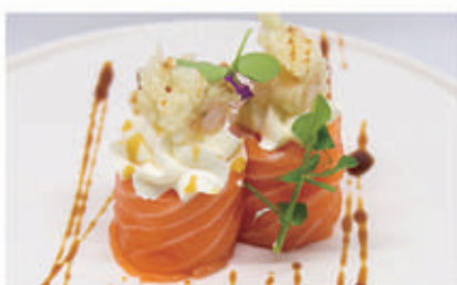
499. BIGNE EBITEN Salmone, phila, gambero in tempura, teriyaki 4.1.2.6.7. € 6,00