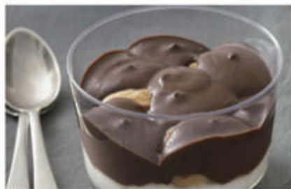
572. COPPA PROFITEROL € 5,00