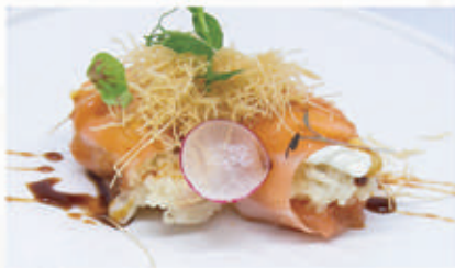
304. FLOWER ROLL Tempura di fiori di zucca, salmone, phila, teriyaki, quinoa 11.4.1.8.6.7. € 6,00