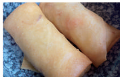
03. INVOLTINI PRIMAVERA Involtini di verdure 6,11. € 4,00