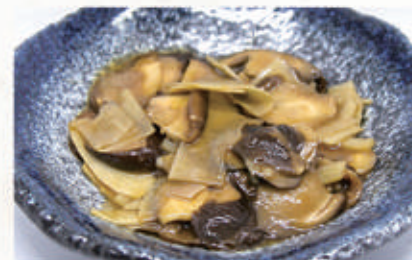
171. GERMOGLI DI BAMBÙ CON FUNGHI 6. € 5,00