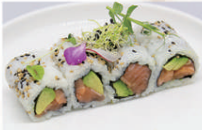
371. URAMAKI SAKE Salmone, avocado, sesamo 11.4.8 € 9,00