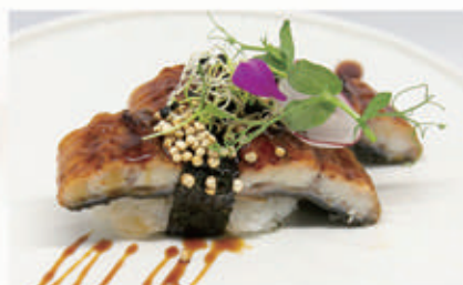
● 469. NIGIRI ANGUILLA Anquilla, salsa teriyaki, quinoa 11.4.1.8.6. € 6,00