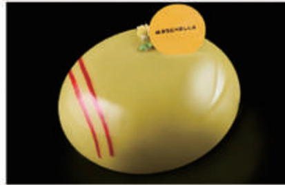
289. DOLCE PISTACCHIO € 6,00