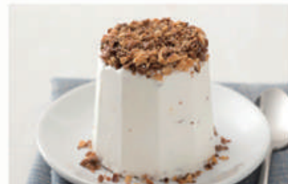
576. TORRONCINO SEMIFREDDO € 4,00