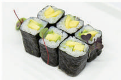
325. HOSO AVOCADO Avocado € 4,00