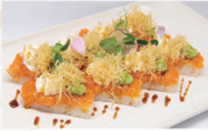
361. OSHIZUSHI SALMON 4PZ Spicy salmone, phila, mousse di avocado, teriyaki, kataifi 10.4.3.1.8.6.7. € 8,00