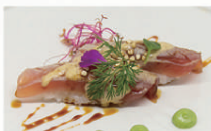
468. NIGIRI TONNO SCOTTATO Tonno scottato, salsa latte, salsa teriyaki, quinoa 10.11.4.3.5.1.8.6.7. € 6,00