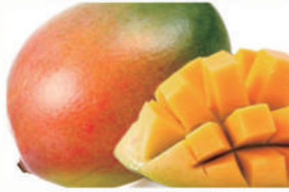
516. FRUTTA MANGO FRESCO € 5,00