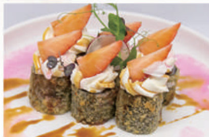
328. HOSO SPECIAL FRAGOLA Hoso salmone fritto, phila, fragola, teriyaki, salsa rose 4.1.6.7 . € 8,00