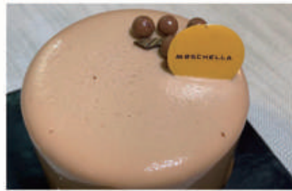
280. DOLCE RIO DE JANEIRO crema mascarpone e tè matcha, pan di spagna imbevuto al matcha guarnito con polvere di tè matcha € 6,00