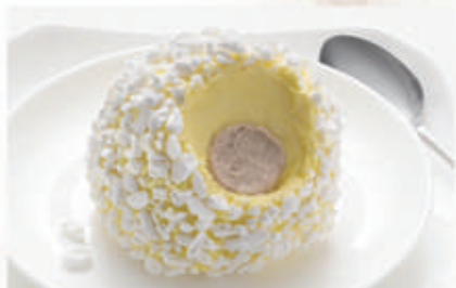
574. TARTUFO BIANCO € 5,00