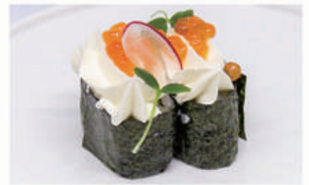
483. GUNKAN IKURA Philadelphia, ikura 4.7. € 5,00