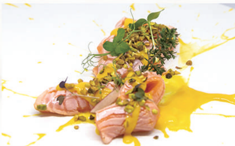
430. SASHIMI FLAMBE Salmone scottato, salsa mango, pistacchio 10.4.3.5.8.7. € 13,00