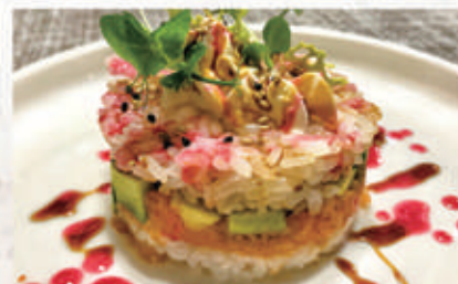
414. WHITE BURGER riso, spicy salmone, avocado, philadelphia, salsa teriyaki e salsa rose, kataifi 11.4.3.1.6.7. € 9,00