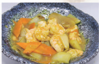
96. GAMBERI AL CURRY 2,6,11 € 8,00