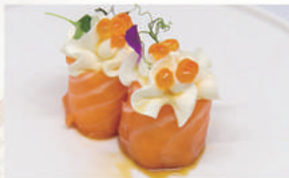
495. BIGNE IKURA Salmone, philadelphia, ikura, ponzu 4.1.6.7. € 6,00