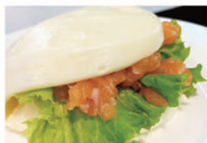
09. BAO TARTARE 1,4,6,11 € 6,00