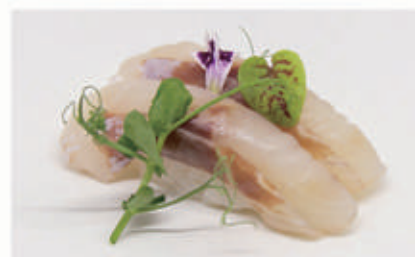
462. NIGIRI BRANZINO nigiri branzino 4 € 5,00