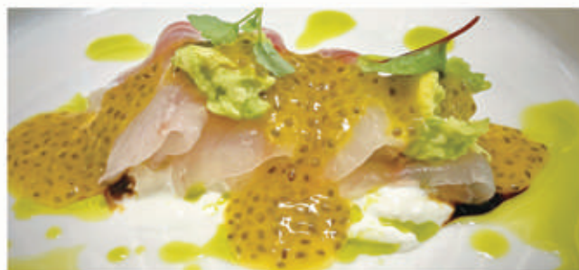
S20. CARPACCIO WHITE CHIA burrata,teriyaki, olio di shiso, avocado, pomodorini, chia marinata con mango 11.4.3.1.6.7 € 13,00