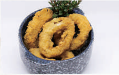
156. CALAMARI FRITTI 1,3,6,11,14 € 7,00