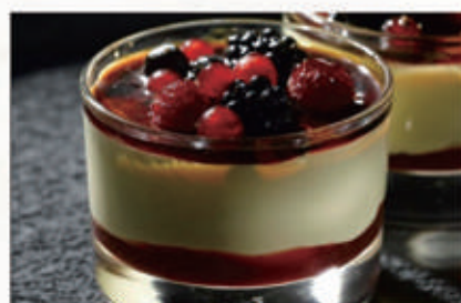
579. COPPA CREME BRULEE FRUTTI BOSCO € 6,00