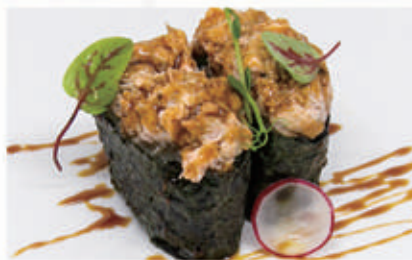
485. GUNKAN MIURA Salmone grigliato, philadelphia, teriyaki 4.1.6.7. € 4,00