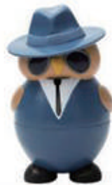
560. GELATO MAN IN BLACK VANIGLIA € 5,00