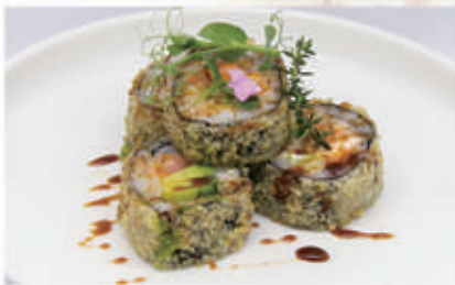
411. FUTOMAKI FRITTO 4PZ Salmone, philadelphia, avocado, tobiko 4.1.6.7. € 6,00