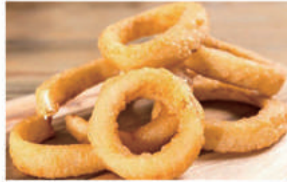
161. ANELLI CIPOLLA FRITTE 1,3. € 5,00