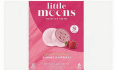
511. MOCHI 2PZ summer raspberry € 4,00