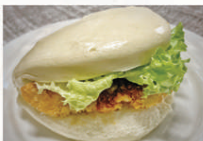
25. BAO CHICKEN 1,3,6,11. € 6,00