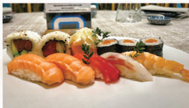
610. SUSHI MISTO 5 nigiri misti, 2 uramaki, 4 hosomaki, 1 gunkan 4.3.7.2. € 10,00