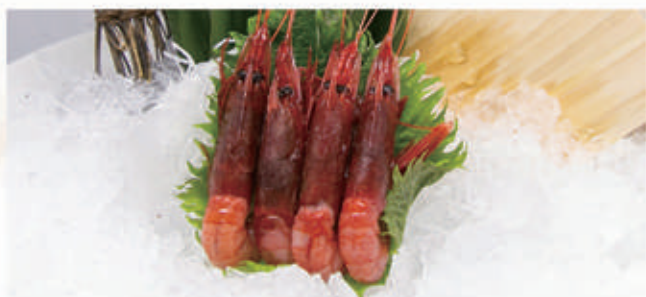
S10. SASHIMI AMAEBI Gambero rosso di marzara 4 pz 2 € 10,00