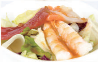
20. KAISEN SALADA 1,2,4,6,11,14 € 8,00