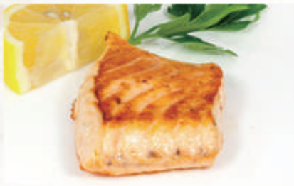
121. SALMONE TEPPANYAKI Salmone alla griglia 6,11 € 8,00