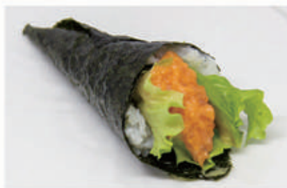
342. TEMAKI SPICY SALMON Insalata, gambero fritto, avocado, erba cipollina 10.4.3.7. € 5,00