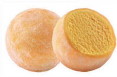
504. MOCHI MANGO 2PZ € 4,00