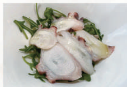
11. INSALATA DI POLIPO E RUCOLA 14. € 8,00