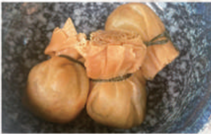
163. FAGOTTINO FRITTO ALLE VERDURE MISTO 1,3,5,6,11 € 6,00