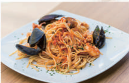
66. SPAGHETTI ALLO SCOGLIO Sugo di pomodoro e frutti di mare 2,14 € 10,00