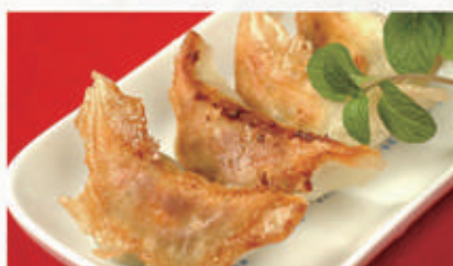
35. RAVIOLI DI CARNE ALLA GRIGLIA 1,3,6,11 € 6,00