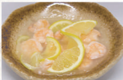
90. GAMBERI AL LIMONE 2 € 8,00