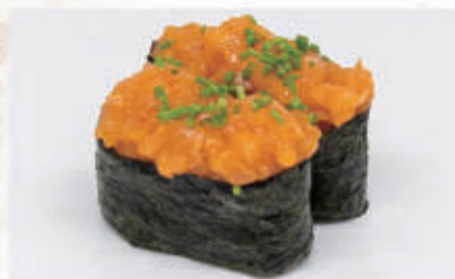
481. GUNKAN SPICY SALMONE