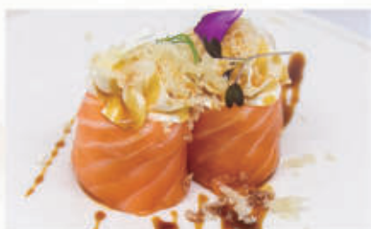
496. BIGNE PHILADELPHIA

Salmone, philadelphia, teriyaki, polvere di tempura 4.1.6.7. € 6,00