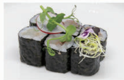
323 HOSO SUZUKI Branzino 4. € 5,00