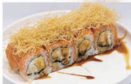
383. TIGER ROLL Gamberi in tempura, maionese, top di salmone, salsa teriyaki e kataifi 4.1.2.8.6.7. € 13,00