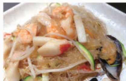
68. SPAGHETTI DI SOIA AI FRUTTI DI MARE verdure e frutti di mare 2,6,11,14 € 6,00