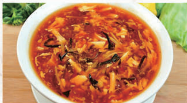
76. ZUPPA SALSA AGROPICCANTE 6,11 € 5,00