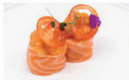
492. BIGNE SALMONE

Bignè scottato salmone, purea, salsa latte, teriyaki, pistacchio 4.5.1.8.6.7. € 6,00