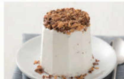
576. TORRONCINO SEMIFREDDO € 4,00