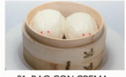
31. BAO CON CREMA ALL'UOVO 1,3,7 € 5,00