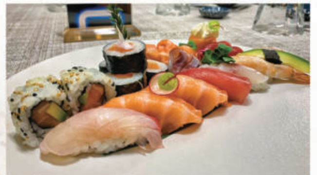
611. SUSHI SASHIMI MISTO PLUS sashimi misto 7pz, 7 nigiri, 2 uramaki, 4 hosomaki, 1 gunkan 4.3.7.2. € 20,00