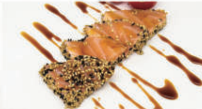
307. SAKE TATAKI salmone scottato con sesamo e teriyaki 4.11.1.6. € 10,00