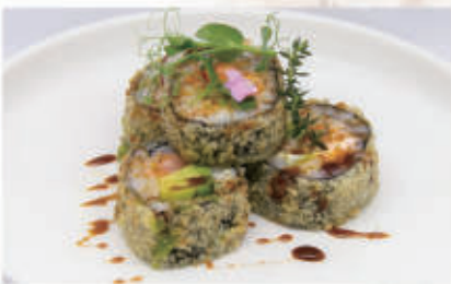
411. FUTOMAKI FRITTO 4PZ Salmone, philadelphia, avocado, tobiko 4.1.6.7. € 6,00