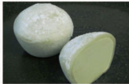
505. MOCHI THE VERDE 2PZ € 4,00