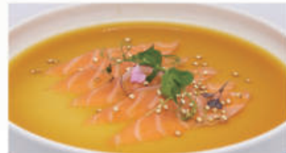
416. CARPACCIO SALMONE Salmone, salsa ponzu, quinoa 11.4.1.8&6. € 8,00