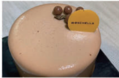
280. DOLCE RIO DE JANEIRO crema mascarpone e tè matcha, pan di spagna imbevuto al matcha guarnito con polvere di tè matcha € 6,00