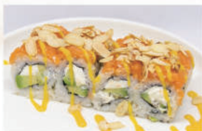
380. MANDORLE ROLL Avocado, philadelphia, spicy salmone esterno, salsa mango 10.4.3.5.8.7 € 12,00