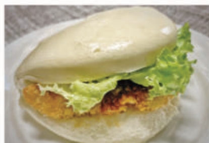
25. BAO CHICKEN 1,3,6,11 € 6,00