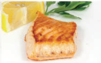
121. SALMONE TEPPANYAKI Salmone alla griglia 6,11 € 8,00