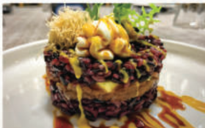
415. BLACK BURGER riso venere, spicy tonno, avocado, philadelphia, salsa teriyaki, salsa mango, kataifi 4.7.3.6.1 € 9,00