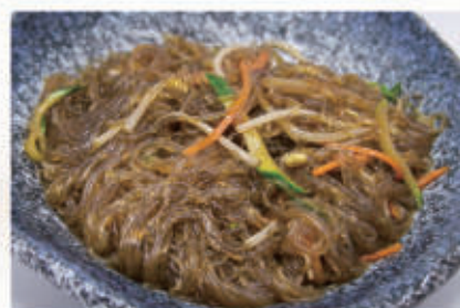
60. SPAGHETTI DI SOIA CON VERDURA 6,11 € 5,00