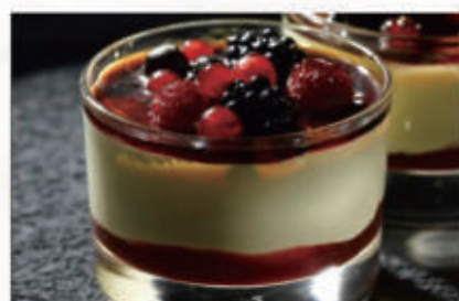
579. COPPA CREME BRULEE FRUTTI BOSCO € 6,00