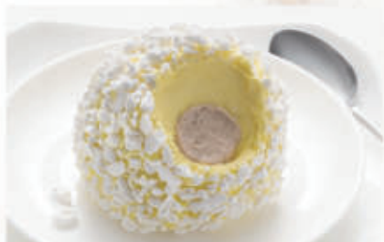
574. TARTUFO BIANCO € 5,00