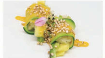
305. VEGETABLE ROLL Zucchine, avocado, mango, tempura di zucca, salsa mango, quinoa 10.11.3.1.8&6.7. € 5,00