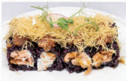
401. BLACK MIURA Salmone grigliato, philadelphia, spisytonno, pasta kataifi, salsa teriyaki 4.1.8.6.7. € 14,00