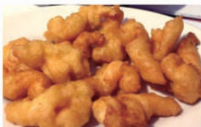
157. POLLO FRITTO 1,3,6,11 € 7,00