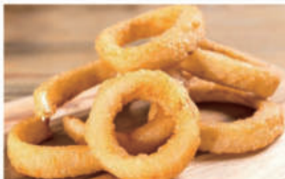
161. ANELLI CIPOLLA FRITTE 1,3. € 5,00