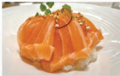
606. CHIRASHI SAKE Salmone, quinoa 4.8. € 10,00