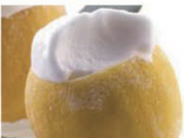
565. GELATO LIMONE RIPIENO € 5,00