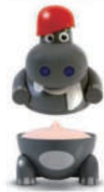
564. GELATO HIP POP FRAGOLA € 5,00