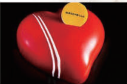
282. DOLCE RED PASSION mousse alla fragola con cremoso alla vaniglia e perline croccanti al cioccolato al Latte, base croccante al cioccolato bianco € 6,00