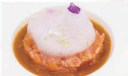
310. TARTARE SALMONE Tartare di salmone, pasta kataifi, salsa yamakawa, schiuma di limone 4.1.6. € 8,00