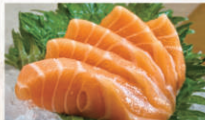
426. SASHIMI SALMONE 5PZ salmone 4. € 8,00