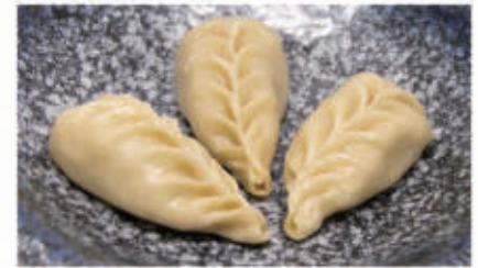
34. RAVIOLI DI VERDURE 1,6,11 € 5,00