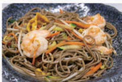
61. YAKI SOBA Pasta di grano saraceno saltato con gamberi e verdure 2,3,6,11 € 10,00