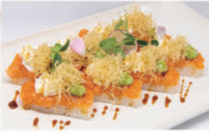
361. OSHIZUSHI SALMON 4PZ Spicy salmone, phila, mousse di avocado, teriyaki, kataifi 10.4.3.1.8.6.7. € 8,00