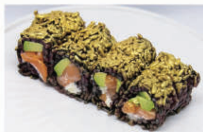
404. BLACK GOLD Salmone, philadelphia, avocado, oro edibile 4.7. 11,00