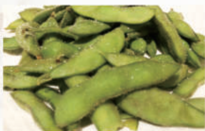
01. EDAMAME Baccelli di soia 6 € 5,00