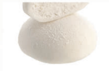
502. MOCHI COCCO 2 PZ € 4,00