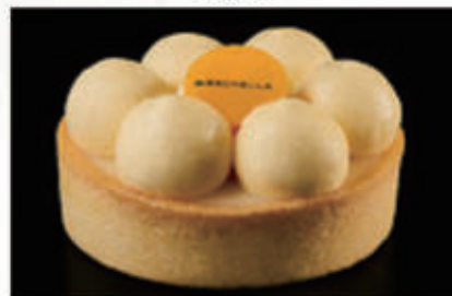
283. DOLCE YUZU TART fondo di pasta frolla, ganache allo yuzu, bavarese alla vaniglia € 6,00