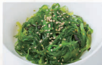
14. GOMMA WAKAME 11 € 7,00