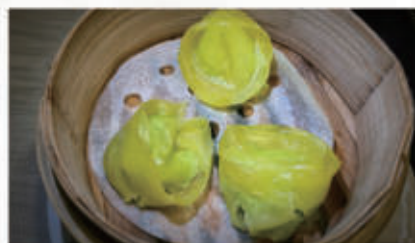
40. RAVIOLI SPINACI 1,6,11 € 5,00