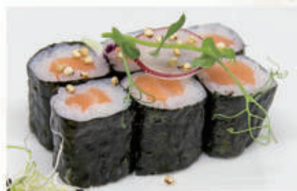
321. HOSO SALMON Salmone 4. € 5,00