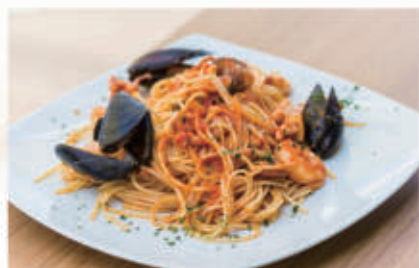
66. SPAGHETTI ALLO SCOGLIO Sugo di pomodoro e frutti di mare 2,14 € 10,00