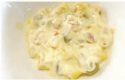
17. INSALATA RUSSA 3 € 6,00