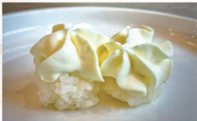
489. BIGNE SNOWBALL riso sushi, philadelphia 3.1.7. € 5,00