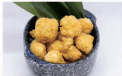
154. BOCCONCINI DI SALMONE FRITTO 1,3,4,6,11 € 6,00