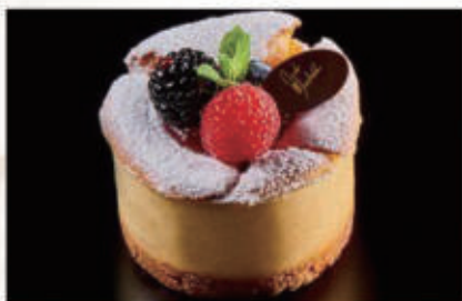
288. DOLCE CHEESECAKE crema al formaggio su crumble salato con confettura di lampone e frutti di bosco € 6,00