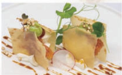
490. MILLEFOGLIE DI TONNO

cotto, maionese, teriyaki, cipolla fritto 4.3.1.7. € 5,00