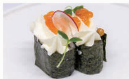
483. GUNKAN IKURA