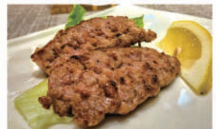
129. SALSICCIA PIASTRA € 6,00