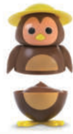
561. GELATO CIP CIOK CIOCCOLATO € 5,00