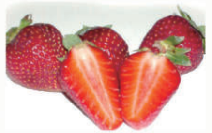
517. FRUTTA FRAGOLA € 4,00