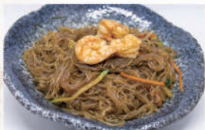
63. SPAGHETTI DI SOIA CON GAMBERI E VERDURA 2,6,11 € 6,00