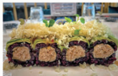
405. BLACK TUNA tonno cotto, maionese top di avocado salsa agropiccante polvere di tempura 4.3.1. € 11,00