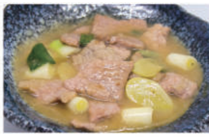
101. MANZO CON ZENZERO E CIPOLLOTTI 6,11 € 7,00