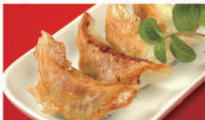
35. RAVIOLI DI CARNE ALLA GRIGLIA 1,3,6,11 € 6,00