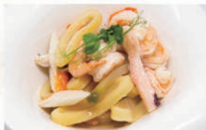
12. INSALATA DI MARE 2,14 € 8,00