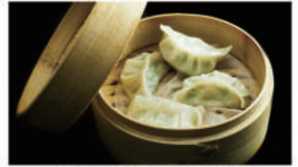
39. RAVIOLI DI POLLO 1,6,11 € 5,00