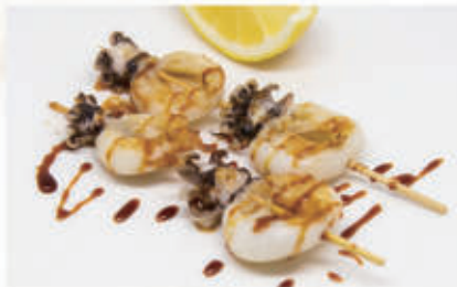
126. YAKI IKA Spiedini di seppie alla griglia 6,11,1,6 € 7,00