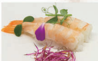
463. NIGIRI GAMBERO COTTO nigiri gambero 2 € 4,00