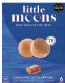
512. MOCHI 2PZ caramel € 4,00