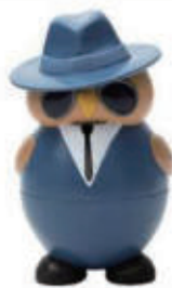
560. GELATO MAN IN BLACK VANIGLIA € 5,00