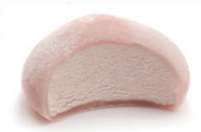
501. MOCHI FRAGOLA 2 PZ € 4,00