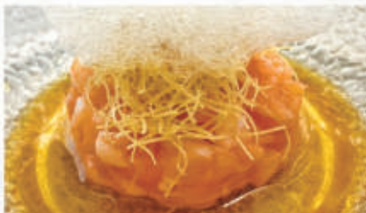
316. TARTARE SALMONE PONZU salmone, ponzu, schiuma di lime 4.1.6. € 8,00