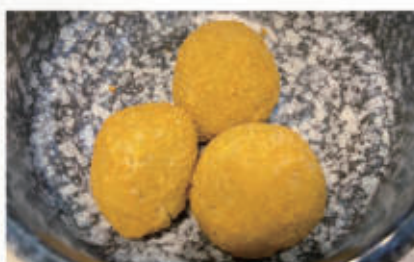
164. OLIVE FRITTI 1,3. € 5,00