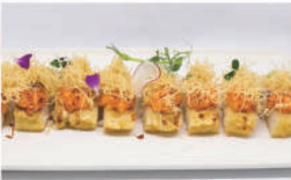
364. OSHIZUSHI TEMPURA PZ Riso in tempura, spicy salmone, mousse di avocado, salsa mango 10.3.1.6.7. € 8,00