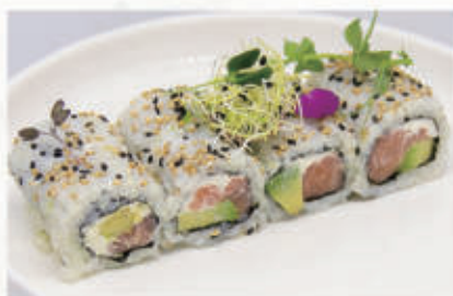
372. URAMAKI PHILADELPHIA Salmone, avocado, philadelphia 4.7 € 9,00