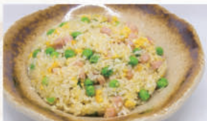
50. RISO CANTONESE Riso con piselli, uova e prosciutto cotto 3 € 5,00