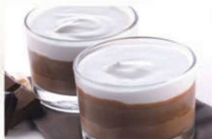
577. COPPA TRE CIOCCOLATI € 5,00