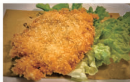
166. COTOLETTA DI POLLO ALLA MILANESE 1,3,6,11 € 6,00