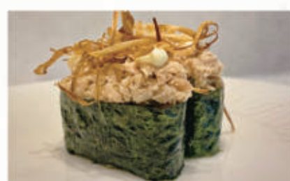
487. GUNKAN TUNA ONION TONNO

pollo fritto, maionese, teriyaki, mandorle 3.5.1.8.6.7. € 4,00