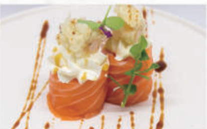
499. BIGNE EBITEN

Salmone, philadelphia, teriyaki, polvere di tempura 4.1.6.7. € 6,00