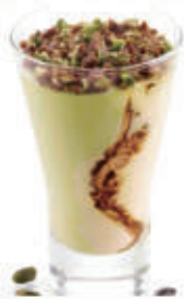
569. GELATO COPPA CREMA PISTACCHIO € 6,00