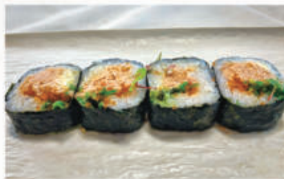
412. FUTO TONNO COTTO tonno cotto, maionese, wakame goma, tobiko, gambero cotto, teriyaki 4.1.3.6.7.14 € 6,00