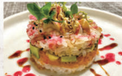
414. WHITE BURGER riso, spicy salmone, avocado, philadelphia, salsa teriyaki e salsa rose, kataifi 11.4.3.1.6.7. € 9,00