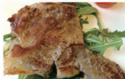
127. COSTATA DI VITELLO Fassona scottata con salsa BBQ € 8,00