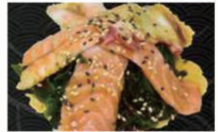
19. SUNOMONO 1,2,4,6,11,14 € 8,00