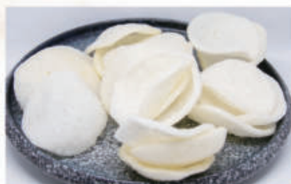
04. NUVOLE DI DRAGO Chips di gambero 2 € 2,00