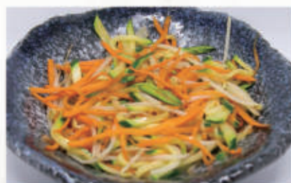
172. VERDURE MISTE SALTATO 6 € 5,00