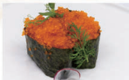
484. GUNKAN TOBIKO