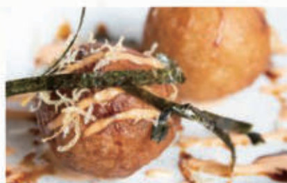
05. POLPETTE DI POLIPO E PATATE FRITTE polpette di polipo e patate fritte con salsa teriyaki 1,3,6,7,11,14 € 7,00