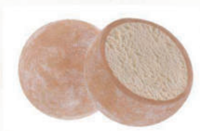
507. MOCHI NOCCIOLA 2 PZ € 4,00