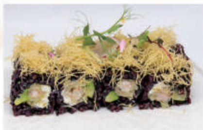
403 BLACK EBITEN Gamberi in tempura, avocado, philadelphia, teriyaki, guarnito con pasta kataifi 1.2.8.6.7. 12,00