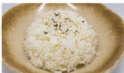
53. RISO BIANCO € 3,00