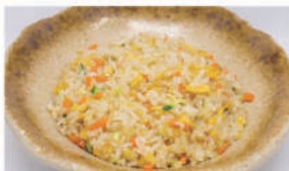
51. RISO SALTATO CON VERDURA E UOVA 3 € 5,00