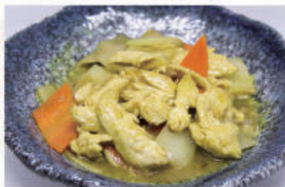
80. POLLO CURRY 6,11 € 7,00