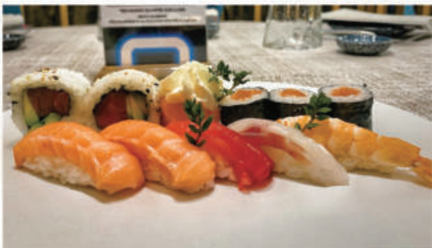
610. SUSHI MISTO 5 nigiri misti, 2 uramaki, 4 hosomaki, 1 gunkan 4.3.7.2. € 10,00