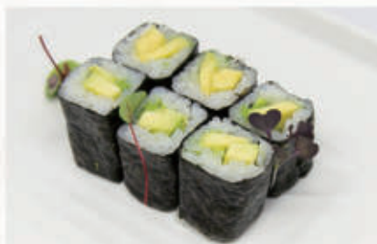
325. HOSO AVOCADO Avocado € 4,00