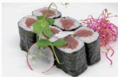
322. HOSO TUNA Tonno 4. € 5,00