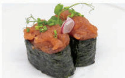
482. GUNKAN SPICY TONNO