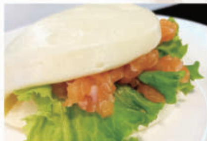
09. BAO TARTARE 1,4,6,11 € 6,00