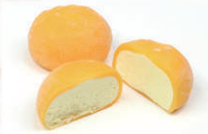
509. MOCHI PASSION 2PZ € 4,00