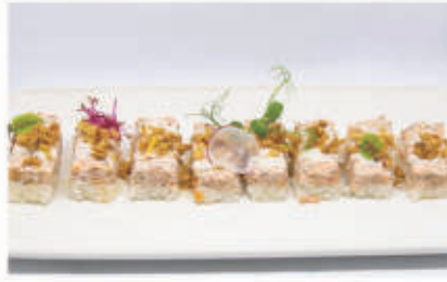
362. OSHIZUSHI MIURA 4PZ Salmon grigliato, phila, salsa latte e cipolla croccante 10.4.3.7 € 8,00