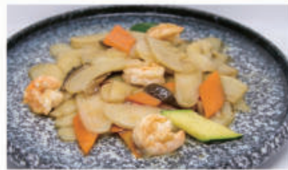
57. GNOCCHI DI RISO CON GAMBERI E VERDURE 2,6,11 € 6,00