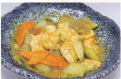
96. GAMBERI AL CURRY 2,6,11 € 8,00