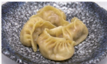
33. RAVIOLI DI CARNE Ravioli di carne 1,3,6,11 € 5,00