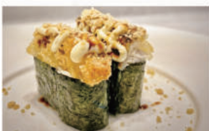
486. GUNKAN CHICKEN

pollo fritto, maionese, teriyaki, mandorle 3.5.1.8.6.7. € 4,00