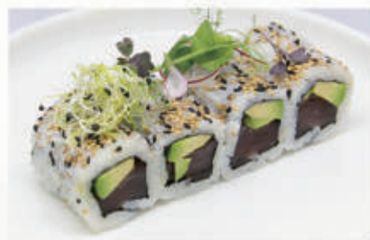
373. URAMAKI MAGURO Tonno, avocado, sesamo 11.4.8 € 9,00