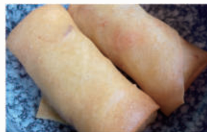
03. INVOLTINI PRIMAVERA Involtini di verdure 6,11 € 4,00