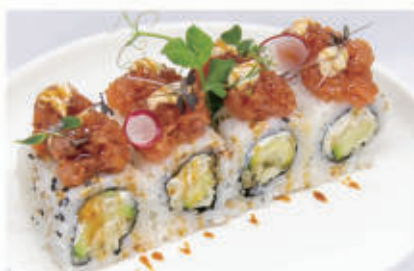
381. ZUCCA ROLL Fiori di zucca in tempura, philadelphia, spicy tonno, salsa tartufo, teriyaki 10.11.4.3.5.1.8.6.7. € 12,00