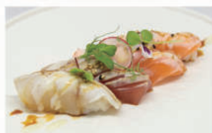
465. NIGIRI SCOTTATO MISTO 4PZ Salmone 2pz, tonno 1pz, branzino 1pz, salsa teriyaki e salsa latte, scottato, sesamo 10.11.4.3.1.8.6.7. € 7,00