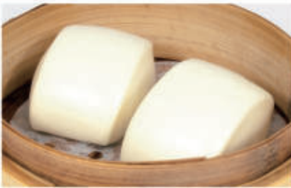
30. PANE AL VAPORE 1,7 € 4,00