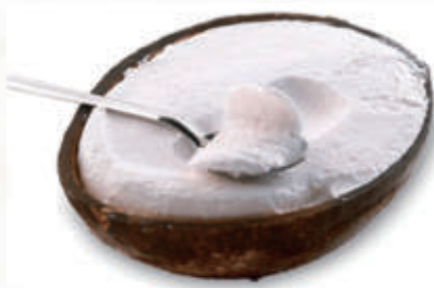
566. GELATO COCCO RIPIENO € 5,00