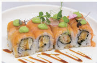
384. SMOKING ROLL maionese, gambero in tempura, top di salmone affumicato, mosse di avocado, teriyaki 10.4.3.1.2.6.7. € 12,00