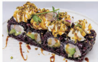
402. BLACK EBI Gambero cotto, philadelphia, avocado, scaglie di tempura, sopra philadelphia, pistacchio e salsa teriyaki 5.1.2.8.6.7. € 12,00