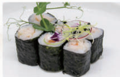
324. HOSO EBI Gambero cotto 2. € 5,00