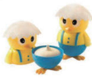
563. GELATO TWITTY FIOR DI LATTE € 5,00