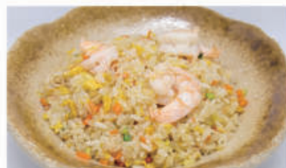
52. RISO SALTATO CON GAMBERI, VERDURA E UOVA 2,3 € 6,00