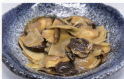
171. GERMOGLI DI BAMBÙ CON FUNGHI 6 € 5,00