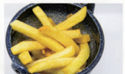
155. PATATINE FRITTE € 5,00