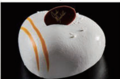
285. DOLCE COCCO E PASSION mousse al cocco, cremoso al mango e passion fruit, pan di spagna e alla base frolla sablée € 6,00