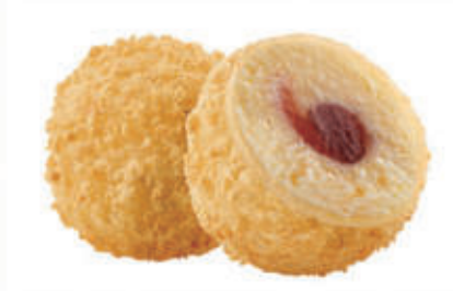
510. MOCHI CHEESECAKE 2PZ € 4,00