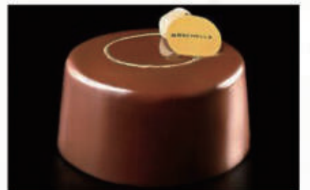
287. DOLCE BOGOTA' mousse al cioccolato fondente al 60%, cremoso alla nocciola con perline di cioccolato, base di frolla € 6,00