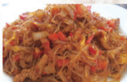
69. SPAGHETTI DI SOIA CON POLLO PICCANTE 6,11 € 6,00