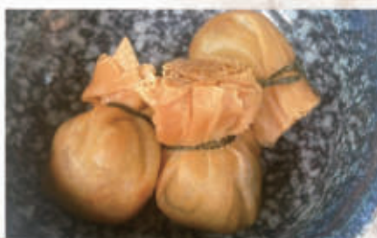
163. FAGOTTINO FRITTO ALLE VERDURE MISTO 1,3,5,6,11 € 6,00