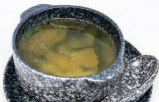
75. ZUPPA MISO Zuppa di soia con alghe e tofu € 4,00