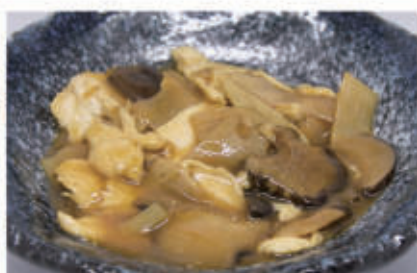
84. POLLO FUNGHI E BAMBÙ 6,11 € 7,00