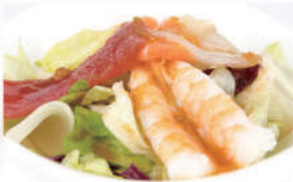
20. KAISEN SALADA 1,2,4,6,11,14 € 8,00