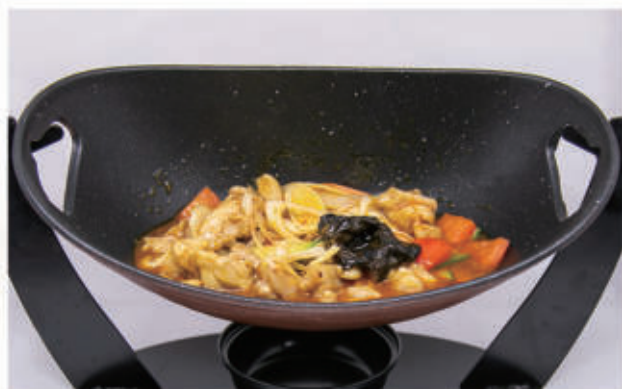
111. PICCOLA PADELLA FAI DA TE CON POLLO Pollo, verdure miste, leggermente piccante 6,11 € 8,00