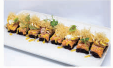
363. OSHIZUSHI BLACK 4PZ Riso venere, spicy salmone flambe, phila, teriyaki, salsa mango, kataifi 10.3.1.8.6.7. € 9,00