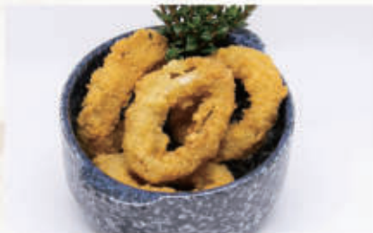
156. CALAMARI FRITTI 1,3,6,11,14 € 7,00