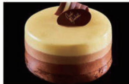
290. DOLCE TRIS DI CIOCCOLATI tre strati di mousse al cioccolato (bianco, al latte e fondente) e alla base un pan di spagna al cacao € 6,00