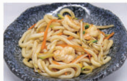
65. YAKI UDON Pasta di riso saltato con gamberi, verdure e uova 2,3,6,11 € 10,00