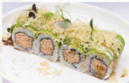
393. MIURA PLUS ROLL Salmone grigliato, philadelphia, top di avocado, salsa teriyaki, salsa latte, croccante di tempura 10.4.3.1.6.7. € 12,00