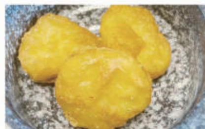
162. CHICKEN NUGGETS 1,3. € 6,00