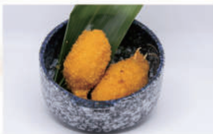
150. CHELE DI GRANCHIO FRITTO 1,2,3 € 6,00