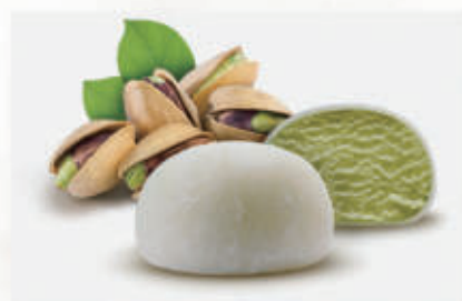
508. MOCHI PISTACCHIO 2PZ € 4,00