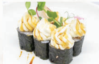
326. HOSO MIURA Salmon grigliato, teriyaki, philadelphia 4.1.6.7. € 5,00