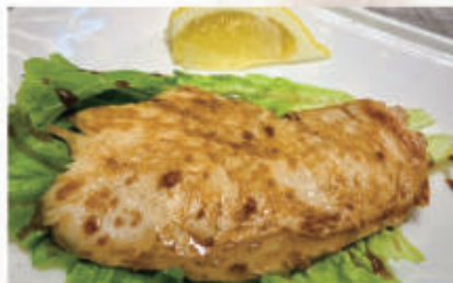
130. PETTO DI POLLO ALLA GRIGLIA 6,11 € 7,00