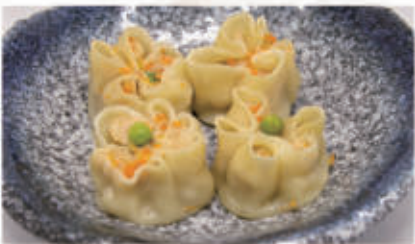
32. RAVIOLI SHAMAI Ravioli di carne con gambero 1,3,6,11 € 6,00