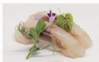
462. NIGIRI BRANZINO nigiri branzino 4 € 5,00