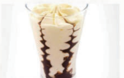
568. GELATO COPPA CIOCCOLATO € 6,00