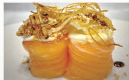
500. BIGNE CHICKEN

Salmone, phila, gambero in tempura, teriyaki 4.1.2.6.7. € 6,00