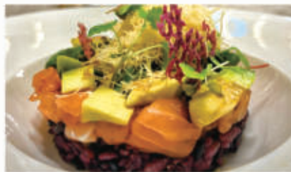
314. TARTARE BLACK RICE riso venere, salmone, avocado, teriyaki, polvere di tempura 4.6.1. € 9,00