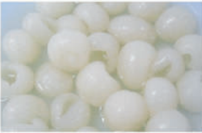
518. FRUTTA MACEDONIA CINESE € 3,00