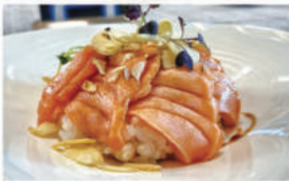
605. CHIRASHI SAKE FLAMBE Salmone scottato, riso, teriyaki, mandorle 4.1.6.5. € 10,00