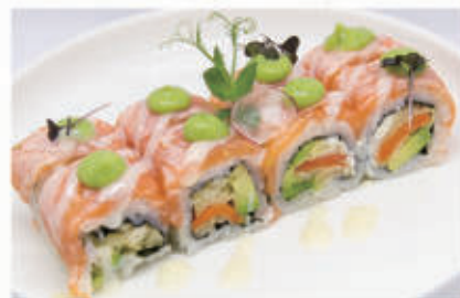
385. TEMPURA SALMONE ROLL Salmone fritto, philadelphia, avocado, top di salmone flambe, mosse di avocado, salsa latte 10.1.6.7. € 14,00