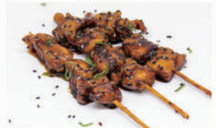
125. YAKI TORI Spiedini di pollo con salsa teriyaki 6,11,1,6 € 7,00