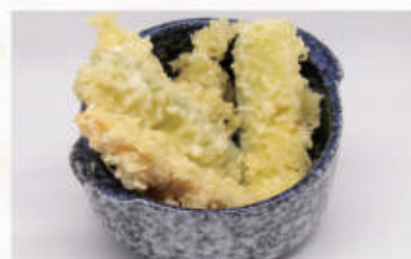
152. TEMPURA YASAI Verdura 1 € 6,00