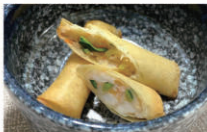
02. HARUMAKI harumaki con verdure e gamberi 2,6,11 € 4,00