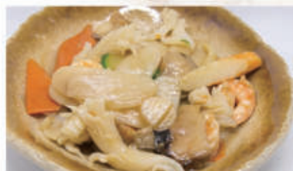
58. GNOCCHI DI RISO AI FRUTTI DI MARE Verdure e frutti di mare 2,6,11,14 € 6,00