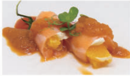
303. ORANGE SAKE ROLL Salmone, arancia, philadelphia, salsa yamakawa, quinoa 11.4.1.8&6.7. € 6,00