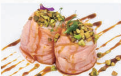
491. BIGNE PUREA

Strati di pasta, ripieno di tonno, philadelphia, salsa verde, teriyaki soffione di quinoa 10.11.3.1.8.6.7. € 7,00