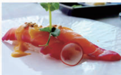
● 471. NIGIRI SALMONE ROSE 2PZ salsa mango quinoa 11.4. € 6,00