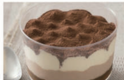
573. COPPA TIRAMISU € 5,00