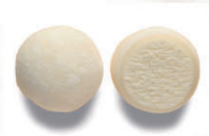
503. MOCHI VANIGLIA 2PZ € 4,00