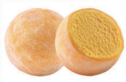
504. MOCHI MANGO 2PZ € 4,00