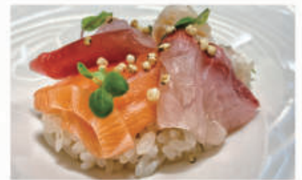
608. CHIRASHI MISTO Misto di pesce, quinoa 4.8. € 10,00