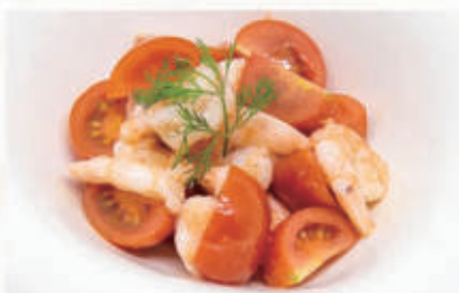
13. INSALATA DI GAMBERI E POMODORINI CON SEDANO 2,9 € 8,00