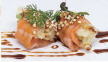
302. EBITEN ROLL Salmone, phila, tempura di gamberi, teriyaki, kataifi 4.1.2&6.7. € 6,00