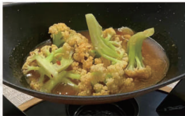
114. PICCOLA PADELLA FAI DA TE CON CAVOLFOIRE PICCANTE 6,11 € 8,00