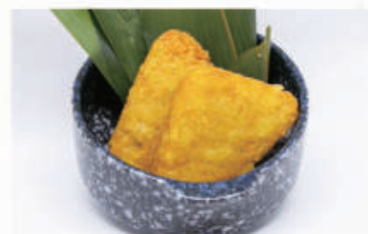
06. POLPETTE DI PATATE FRITTE polpette di patate fritte 1,3,6,7,11 € 5,00