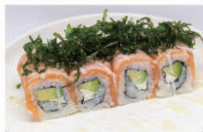
382. RUCOLA ROLL Avocado, philadelphia, sopra salmone, salsa latte, scottato, rucola fritta 10.4.3.7. € 12,00