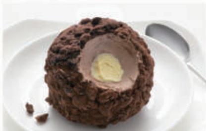
575. TARTUFO CLASSICO € 5,00