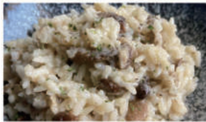
56. RISOTTO CON FUNGHI PORCINI € 12,00