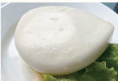
10. BAO TEMPURA 1 € 6,00