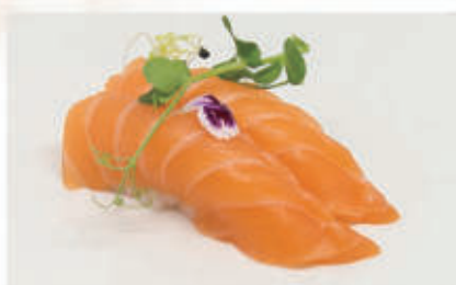
460. NIGIRI SALMONE nigiri salmone 4 € 4,00