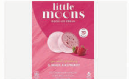
511. MOCHI 2PZ summer raspberry € 4,00