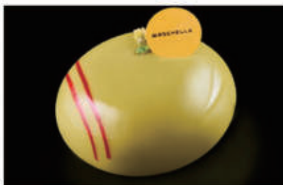
289. DOLCE PISTACCHIO € 6,00