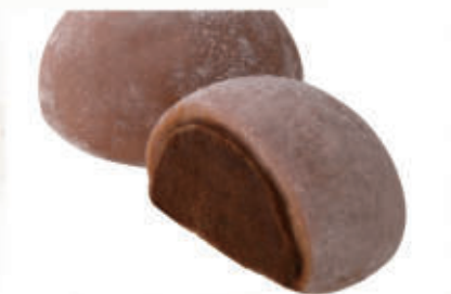
506. MOCHI CIOCCOLATO 2 PZ € 4,00