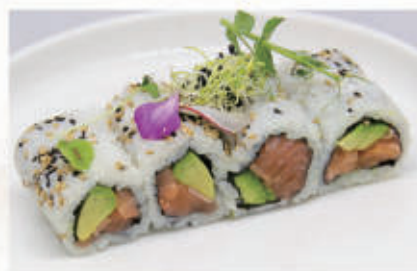
371. URAMAKI SAKE Salmone, avocado, sesamo 11.4.8 € 9,00