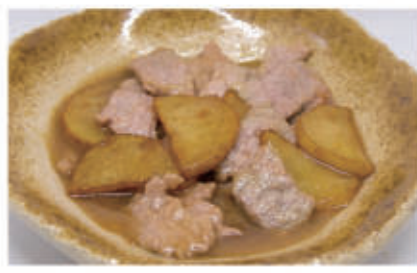
102. MANZO CON PATATE 6,11 € 7,00