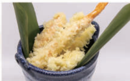
151. TEMPURA MORIOWASE Gamberi e verdura 1,2 € 7,00