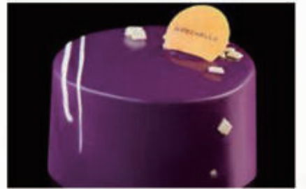
281. DOLCE BOSCO mousse al mascarpone e vaniglia, cremoso ai frutti di bosco, pan di spagna al cacao € 6,00