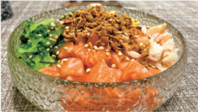
601. POKE SUSHI mango, avocado, gamberi cotto, wakame, salmone, cipolla frita, salsa teriyaki, quinoa 4.14.1.6.8. € 8,00