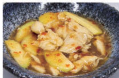
83. POLLO ALLA MALESIA € 7,00