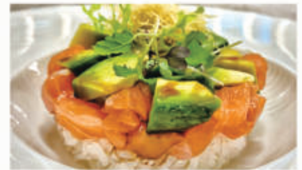
315. TARTARE WHITE RICE riso sushi, salmone, avocado, teriyaki, polvere di tempura 4.1.6. € 9,00